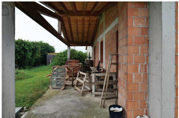
10. Vista del portico a sud.