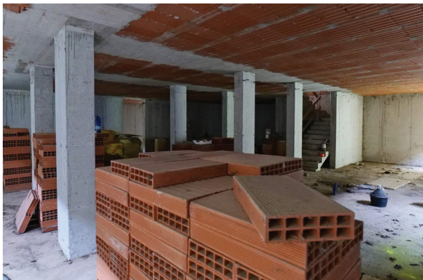
37. Piano interrato (4 di 6).

LOTTO UNICO - Un fabbricato per abitazione al grezzo, un magazzino, un'area scoperta di pertinenza. Volpago del Montello (TV), Via Levada, 22.