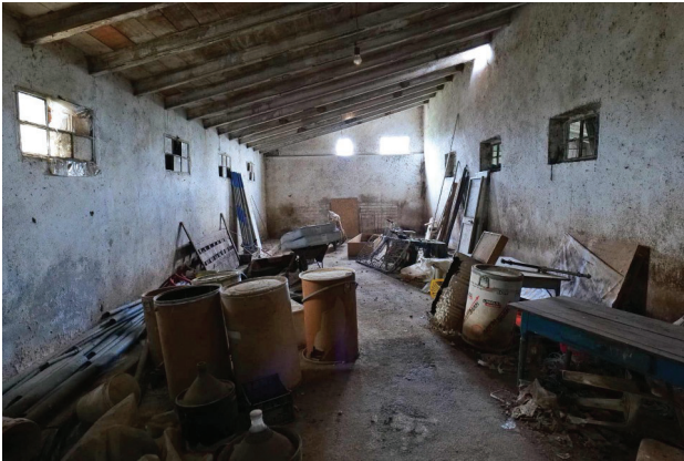
43. Piano terra, magazzino da dividere (1 di 2).

LOTTO UNICO - Un fabbricato per abitazione al grezzo, un magazzino, un'area scoperta di pertinenza. Volpago del Montello (TV), Via Levada, 22.