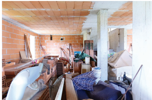
18. Piano terra (1 di 9)