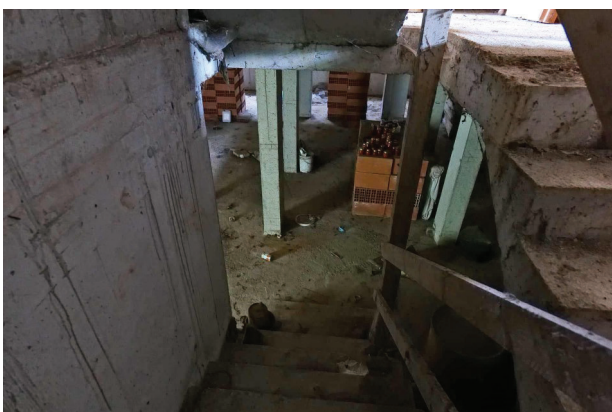
33. Piano interrato, discesa scala.