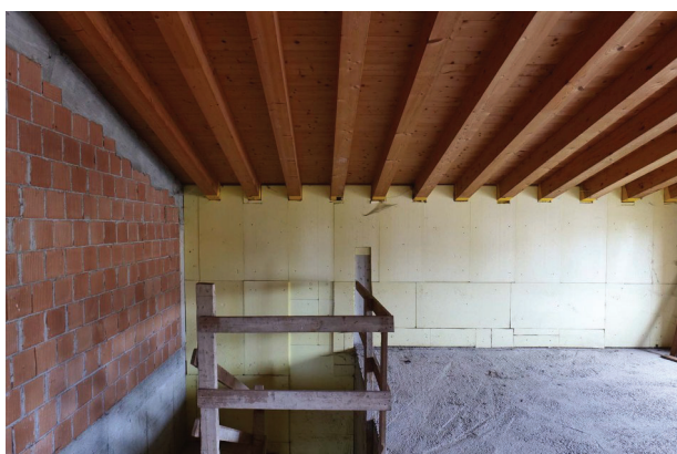
29. Piano primo sottotetto (3 di 5) - parete ovest.