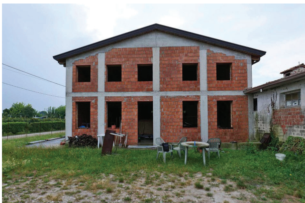
6. Vista prospetto nord abitazione.