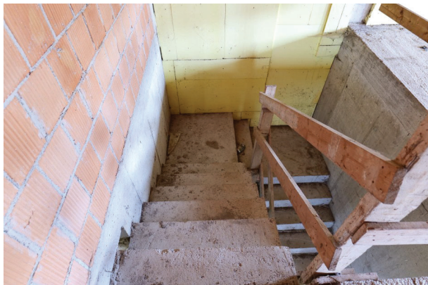
32. Piano terra, scala verso il piano interrato.