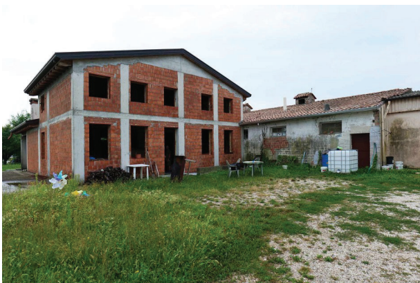
4. Vista fabbricato per abitazione e magazzino (a destra).