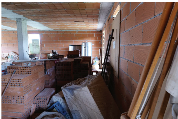
26. Piano terra ( 9 di 9).