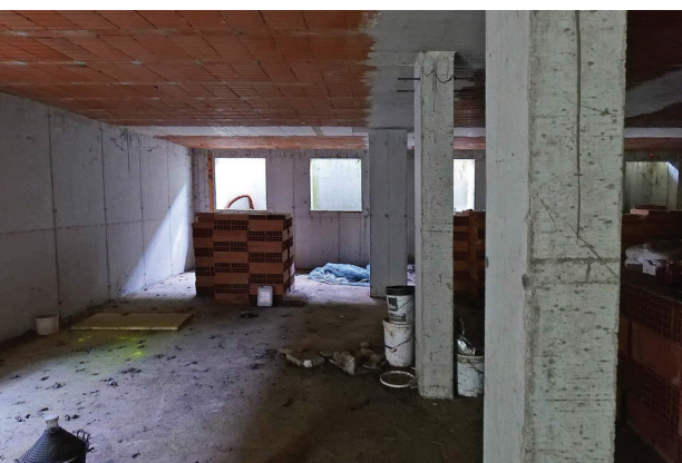
35. Piano interrato (2 di 6).