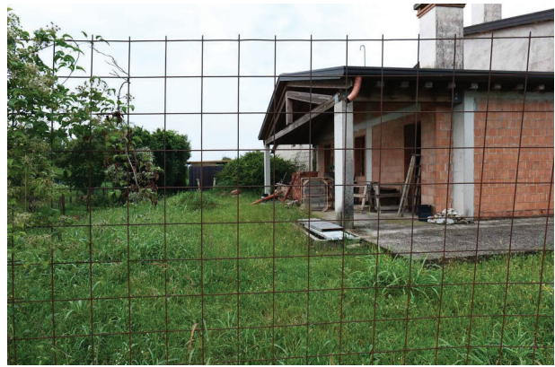
8. Vista portico abitazione a sud e B.C.N.C. sub. 14.