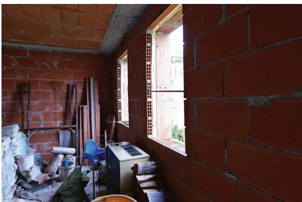
23. Piano terra (6 di 9).