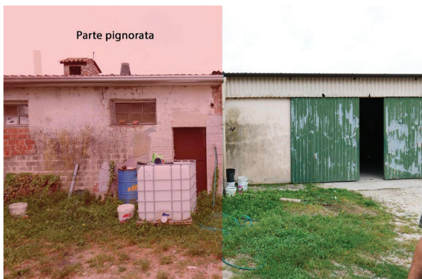
5. Identificazione magazzino pignorato.