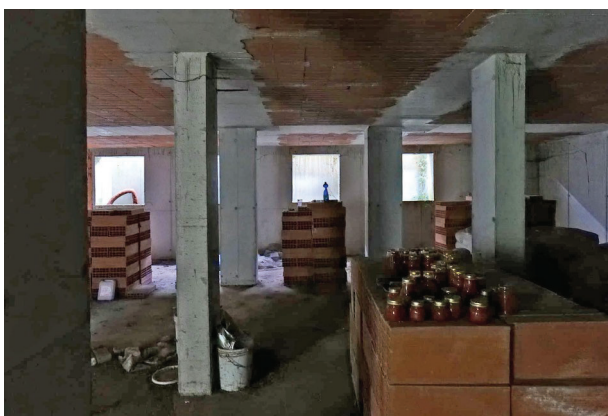
36. Piano interrato (3 di 6).