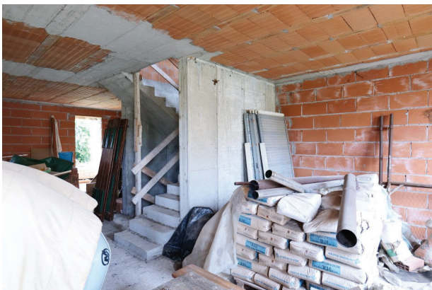
21. Piano terra (4 di 9) – scala ad ovest.