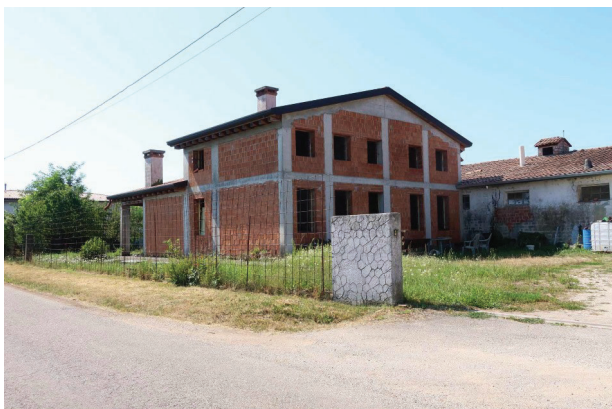
3. Vista fabbricato per abitazione.