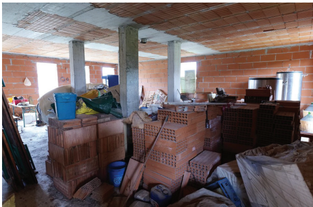
25. Piano terra (8 di 9).

LOTTO UNICO- Un fabbricato per abitazione al grezzo, un magazzino, un'area scoperta di pertinenza. Volpago del Montello (TV), Via Levada, 22.