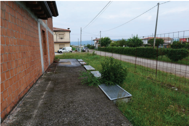
17. Vista verso nord, lato via Levada.