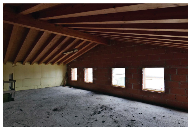
30. Piano primo sottotetto (4 di 5) -angolo nord ovest.