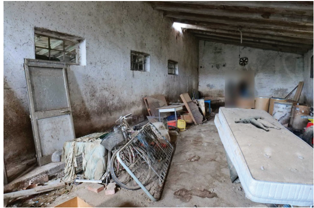
44. Piano terra, magazzino da dividere (2 di 2).