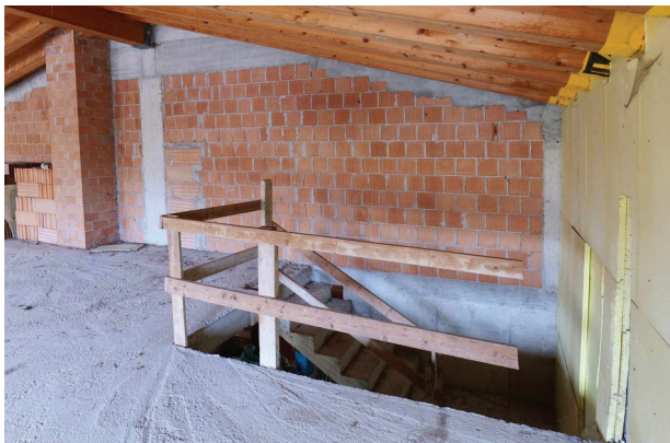
31. Piano primo sottotetto (5 di 5) - arrivo scala.

LOTTO UNICO - Un fabbricato per abitazione al grezzo, un magazzino, un'area scoperta di pertinenza. Volpago del Montello (TV), Via Levada, 22.