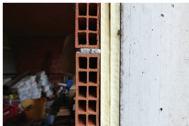
24. Piano terra (7 di 9) stratigrafia parete nord.