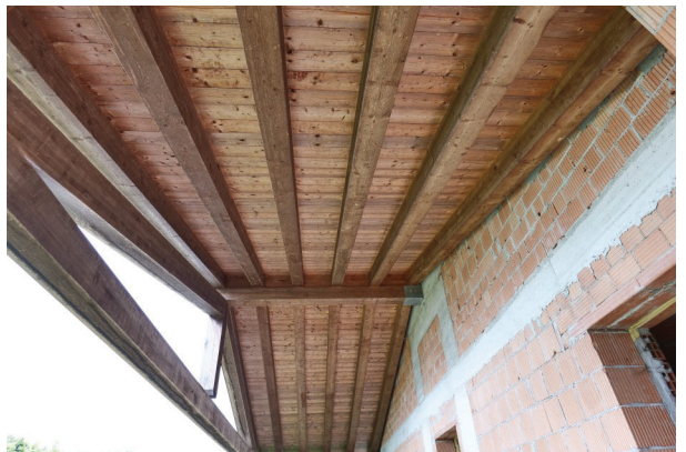
12. Vista struttura del portico (2 di 2).