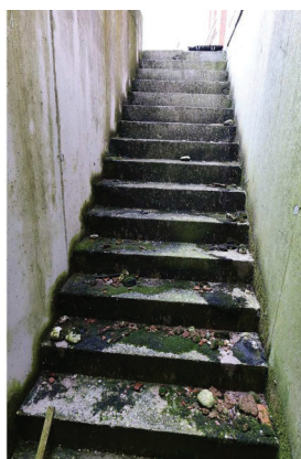
40. Piano interrato, scala esterna verso nord.