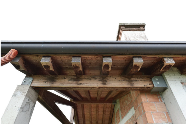
11. Vista struttura del portico (1 di 2).