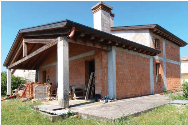
9. Vista prospettiva sud est.