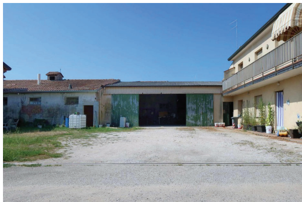
2. Ingresso da Via Levada (attraverso altra proprietà).