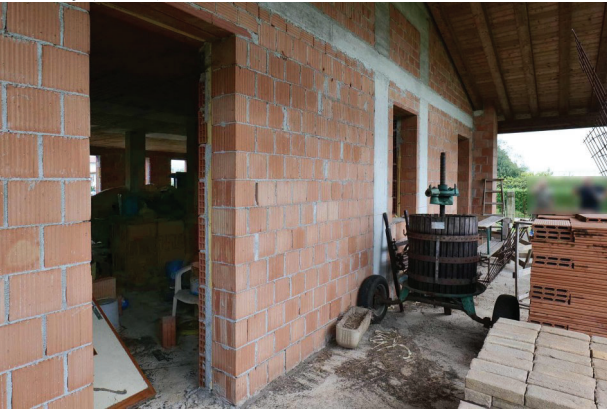
15. Piano terra, portico a sud.