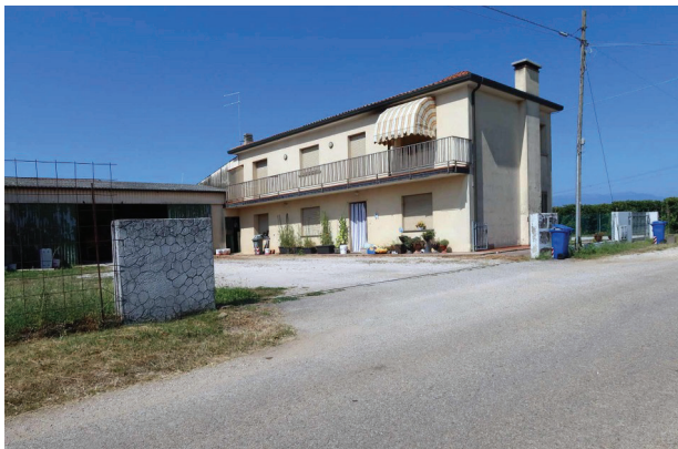
1. Ingresso da Via Levada (attraverso altra proprietà).

LOTTO UNICO- Un fabbricato per abitazione al grezzo, un magazzino, un'area scoperta di pertinenza. Volpago del Montello (TV), Via Levada, 22.