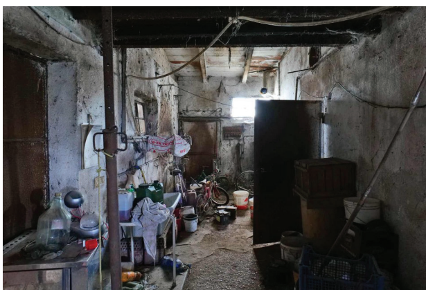
42. Piano terra - magazzino, ingresso (2 di 2).