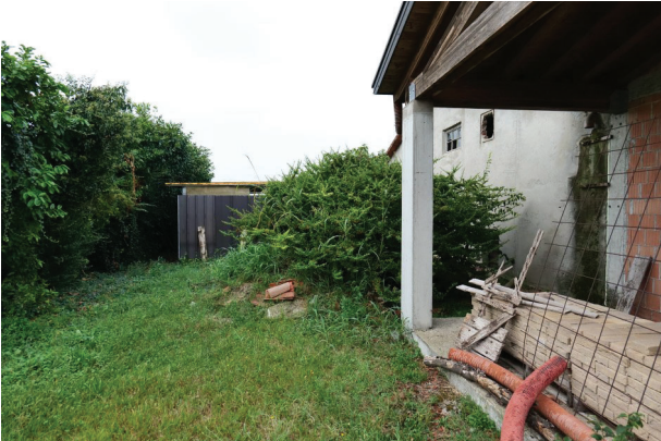
13. Vista verso ovest bene comune con censibile sub. 14 (1 di 2).

LOTTO UNICO - Un fabbricato per abitazione al grezzo, un magazzino, un'area scoperta di pertinenza. Volpago del Montello (TV), Via Levada, 22.