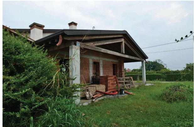
14. Vista verso est bene comune con censibile sub. 14 (2 di 2).