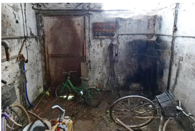
41. Piano terra - magazzino, ingresso (1 di 2).