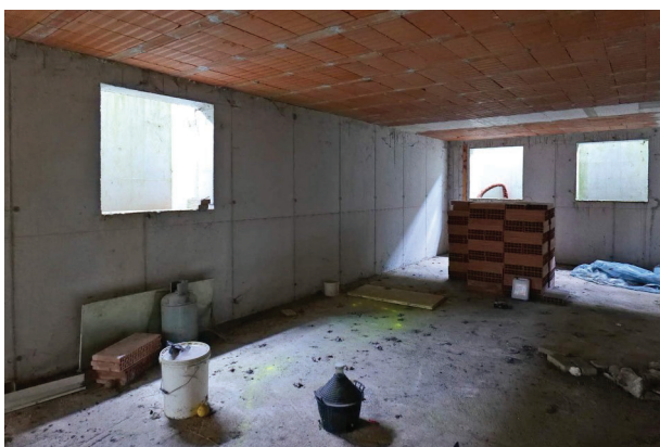
34. Piano interrato (1 di 6).