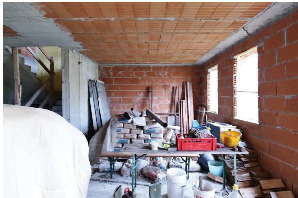
20. Piano terra (3 di 9).