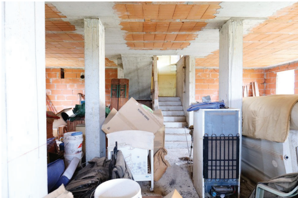
19. Piano terra (2 di 9).

LOTTO UNICO - Un fabbricato per abitazione al grezzo, un magazzino, un'area scoperta di pertinenza. Volpago del Montello (TV), Via Levada, 22.