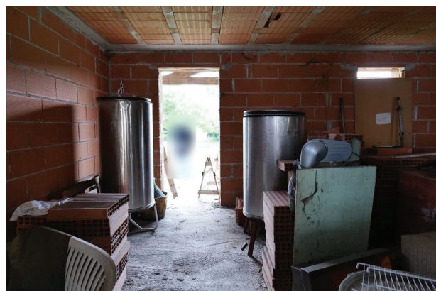
22. Piano terra (5 di 9) – uscita verso nord.