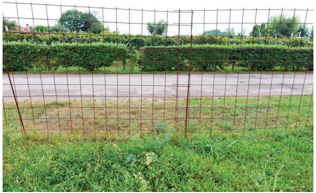
16. Nuovo ingresso carrabile da Via Levada.