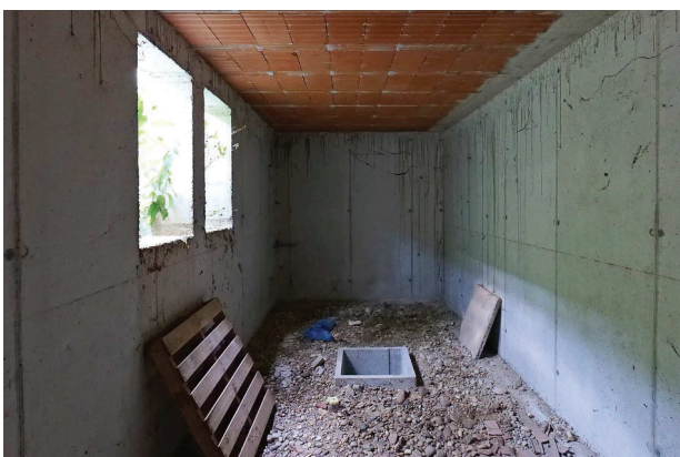
39. Piano interrato (6 di 6).