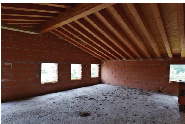
27. Piano primo sottotetto (1 di 5) - angolo nord est.