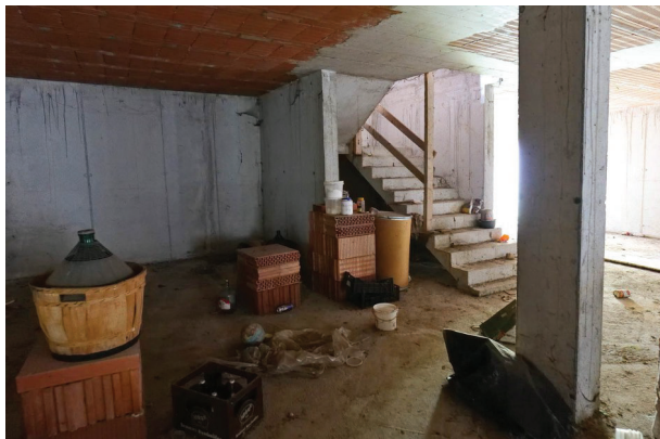
38. Piano interrato (5 di 6).