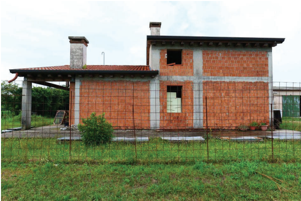
7. Vista prospetto est abitazione.

LOTTO UNICO- Un fabbricato per abitazione al grezzo, un magazzino, un'area scoperta di pertinenza. Volpago del Montello (TV), Via Levada, 22.