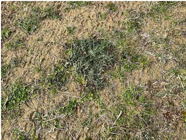
Lotto 1: terreno nudo