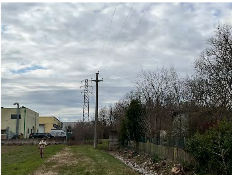
Lotto 2: confine nord della particella 14 (a sinistra)