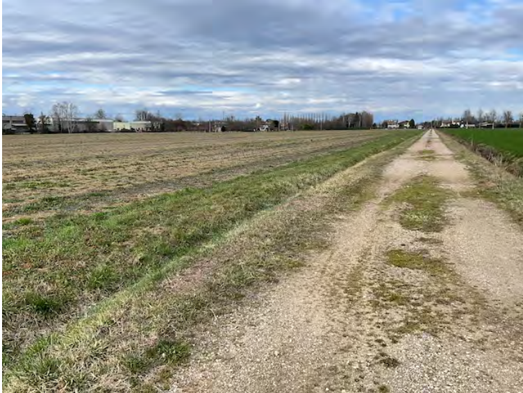
Lotto 2: a sinistra la particella 152 e strada degli Angeli vista verso nord