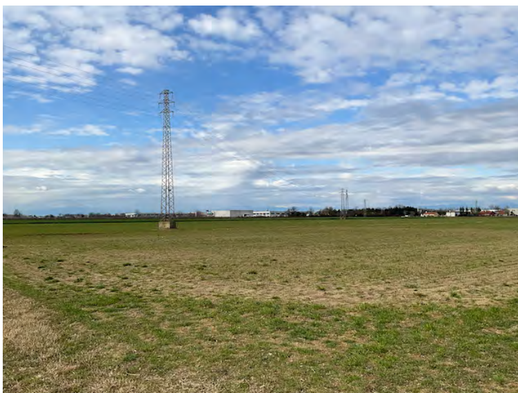
Lotto 1: elettrodotto