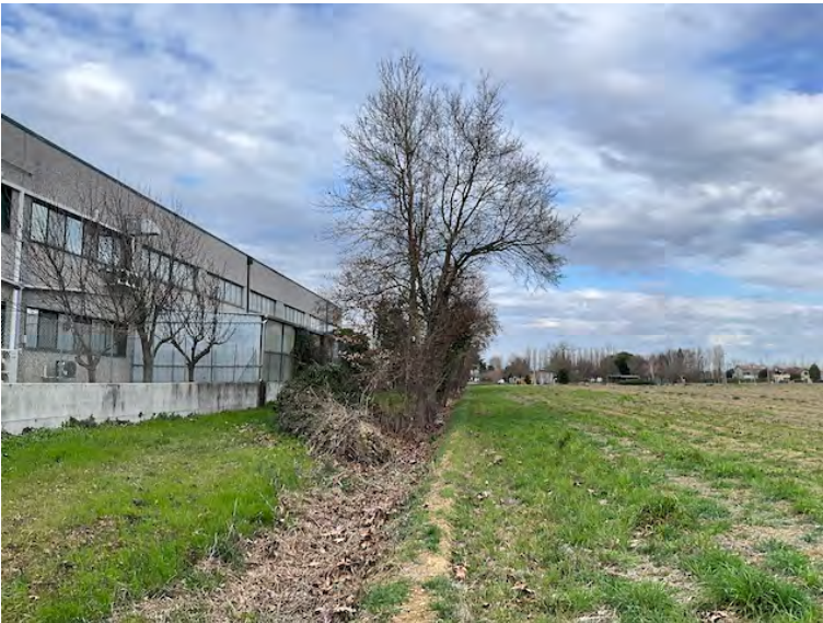
Lotto 2: una siepe arborea è cresciuta all'interno del fosso che separa l'area produttiva (a sinistra) dalla particella 14 (a destra)