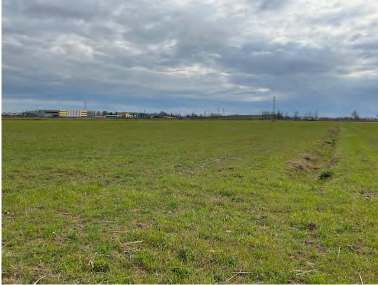
Lotto 1: particella 149 vista verso nord e area produttiva