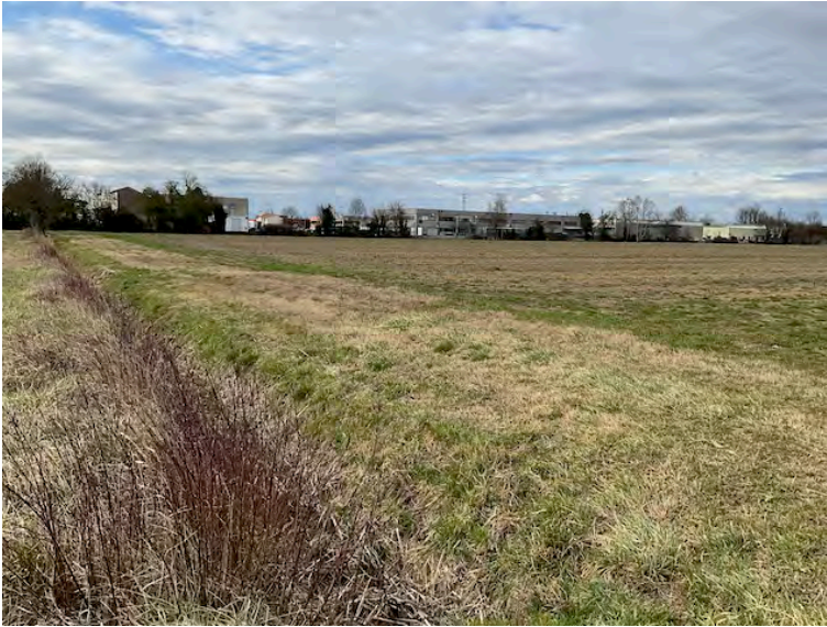
Lotto 2: vista verso nord dal confine sud