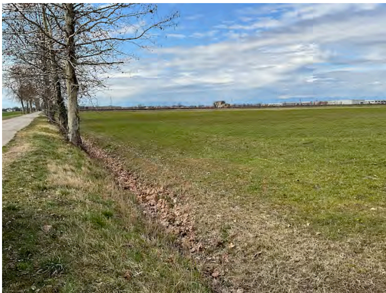
Lotto 1: accesso da sud a sinistra Via degli Angeli