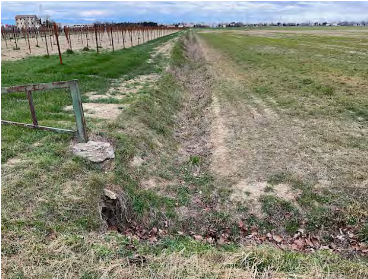
Lotto 1: confine sud-ovest, a sinistra la particella 47. Sullo sfondo la particella 38 priva di fabbricato, ancora riportato sulla mappa catastale non aggiornata