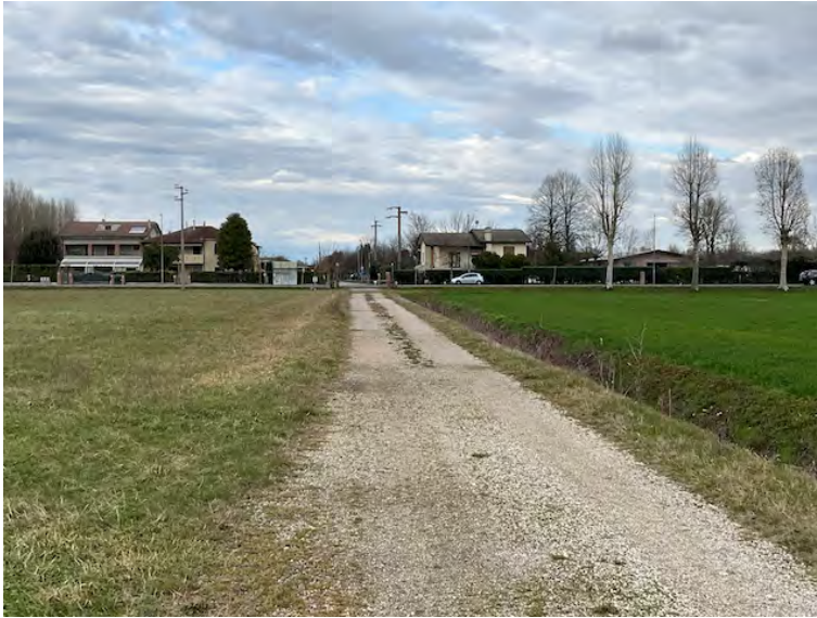
Lotto 2:accesso nord da Via san Michele, a sinistra la particella 152