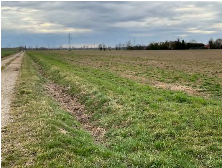
Lotto 2:vista da nord verso sud, a sinistra Strada degli Angeli, a destra le particelle 152 e 14, sullo sfondo l'elettrodotto