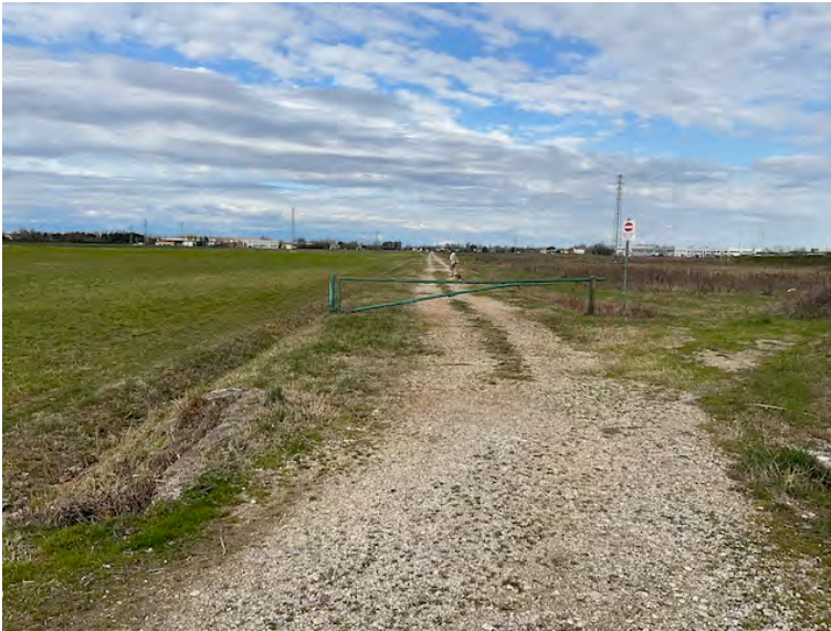
Lotto 1: accesso da sud, proseguenza Via degli Angeli