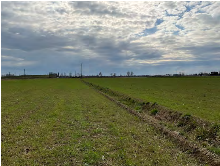
Lotto 1: fosso di scolo