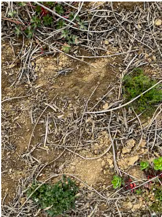
Lotto 2: residui dell'attività agricola (soia)