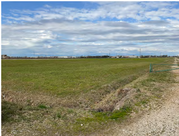
Lotto 1: accesso da sud