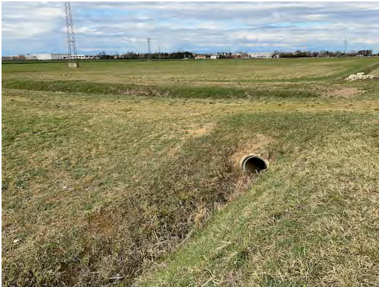
Lotto 1: capezzagna e fosso di scolo