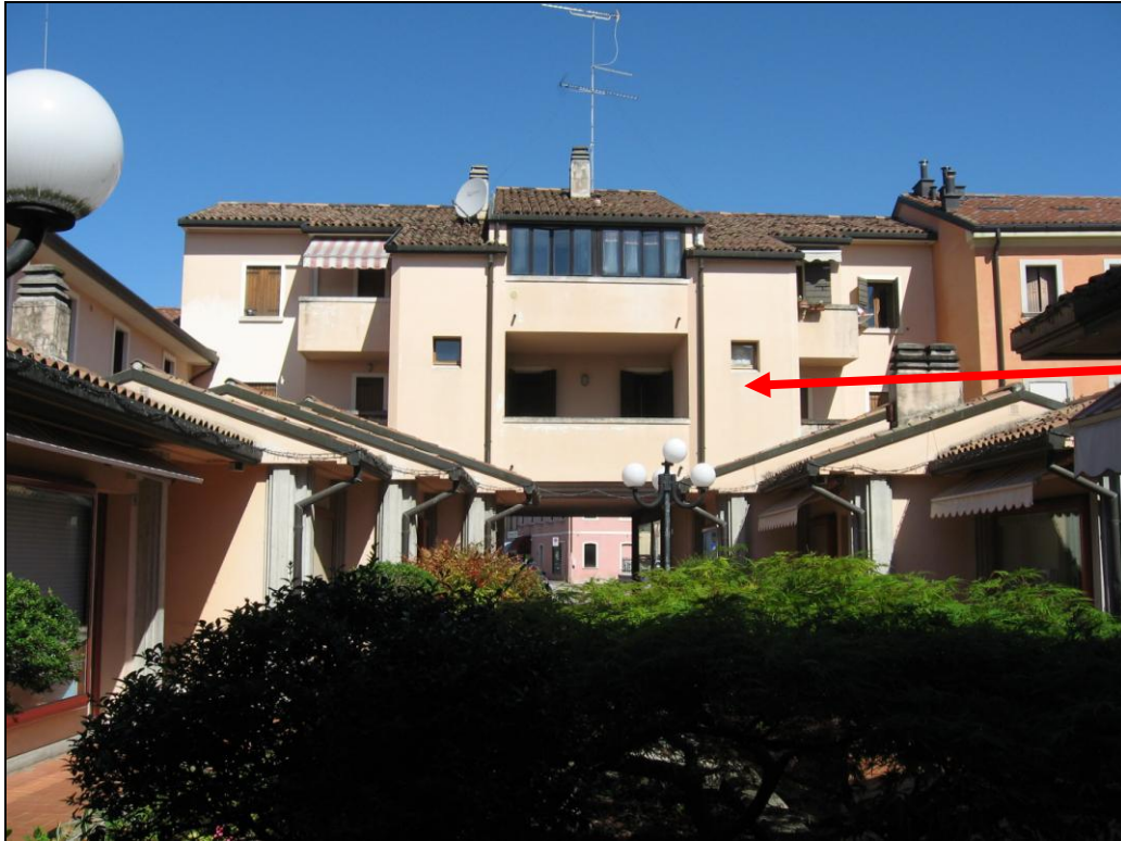
vista dell'affaccio Sud dell'immobile dalla corte comune interna

I serramenti esterni dell'appartamento sono costituiti da: finestre costituite da telai con specchiature in vetrocamera semplice e scuri in legno, il portoncino d'ingresso è in legno, la porta del magazzino e il portone del garage al piano interrato sono in profilati metallici.