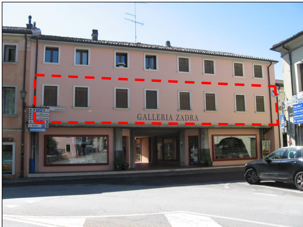
vista dell'affaccio Nord/Ovest dell'immobile oggetto di esecuzione