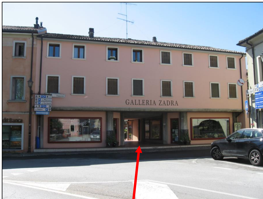
Accesso pedonale da via Capovilla

l'accesso pedonale agli immobili avviene, tramite la Galleria Zadra comune con le altre unità presenti, sia da via Capovilla che dalla piazza Caduti nei Lager; l'accesso carroia all'interrato avviene tramite una rampa direttamente dalla piazza Caduti nei Lager; il tutto come da foto seguenti: