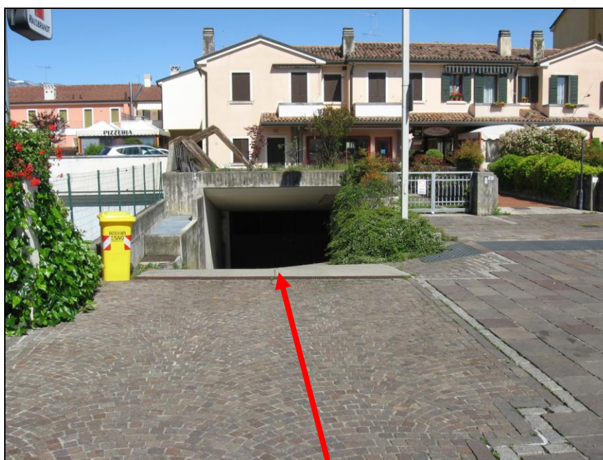
Accesso carroia da piazza Caduti dei Lager