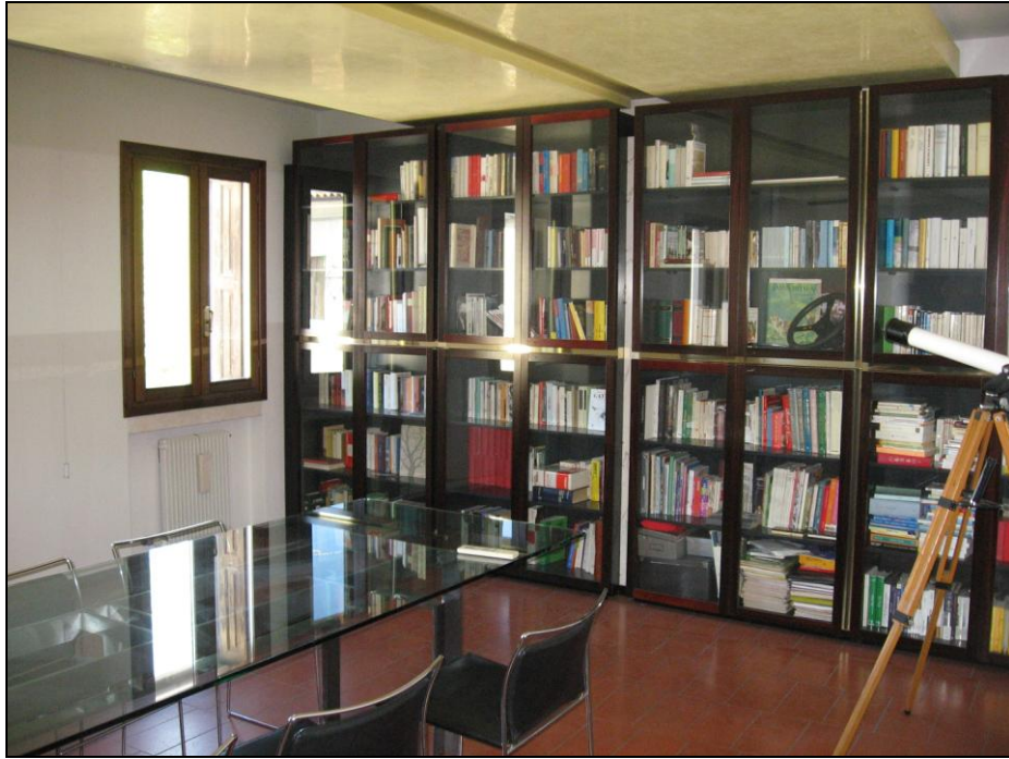
Piano primo - locale “sala stipule” (vedasi planimetrie catastali)