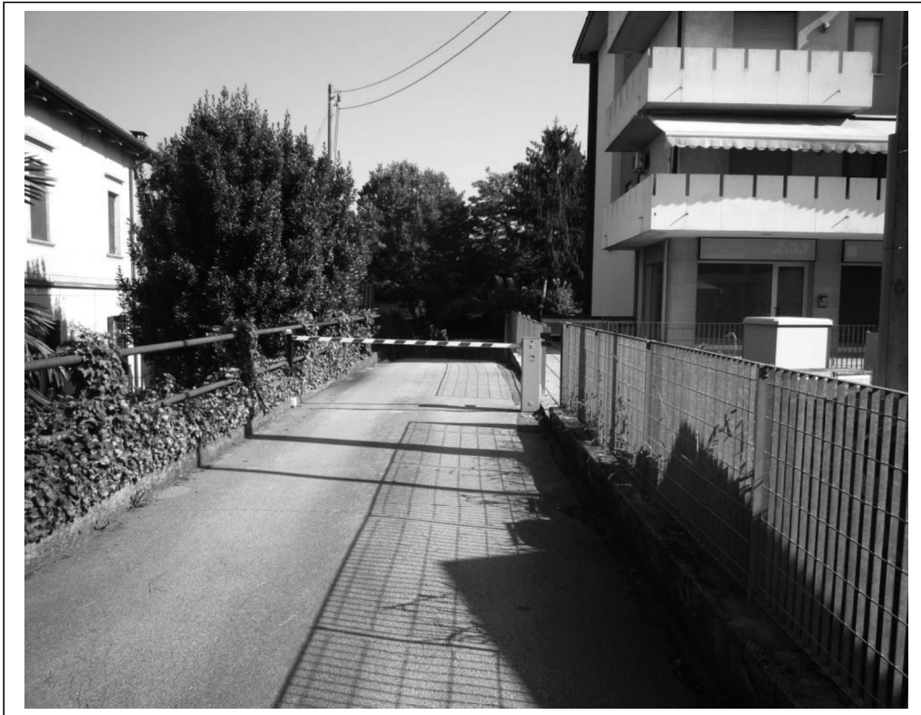
Percorso di accesso alla rampa garage