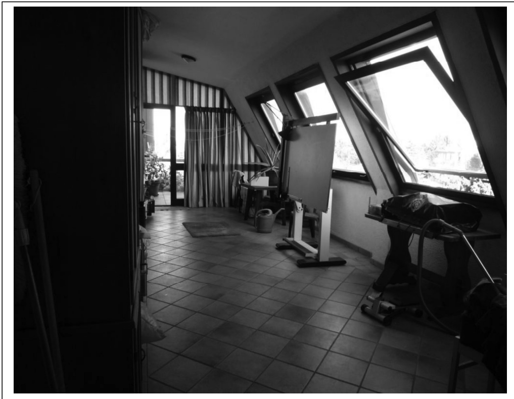
Locale pluriuso sulla terrazza a nord