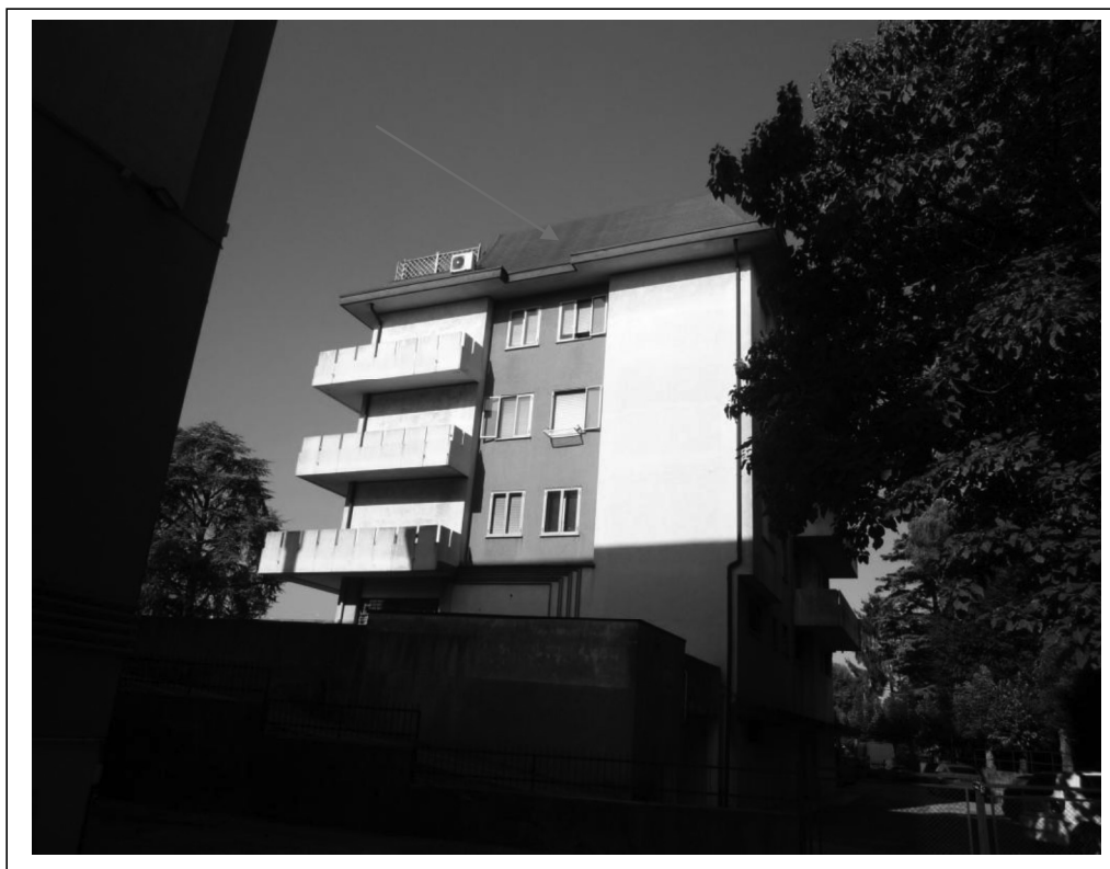
Vista est del fabbricato