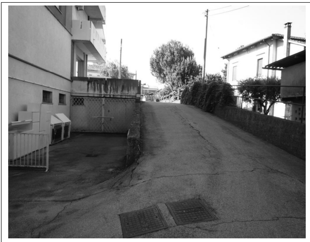
Rampa di accesso al piano interrato dei garage