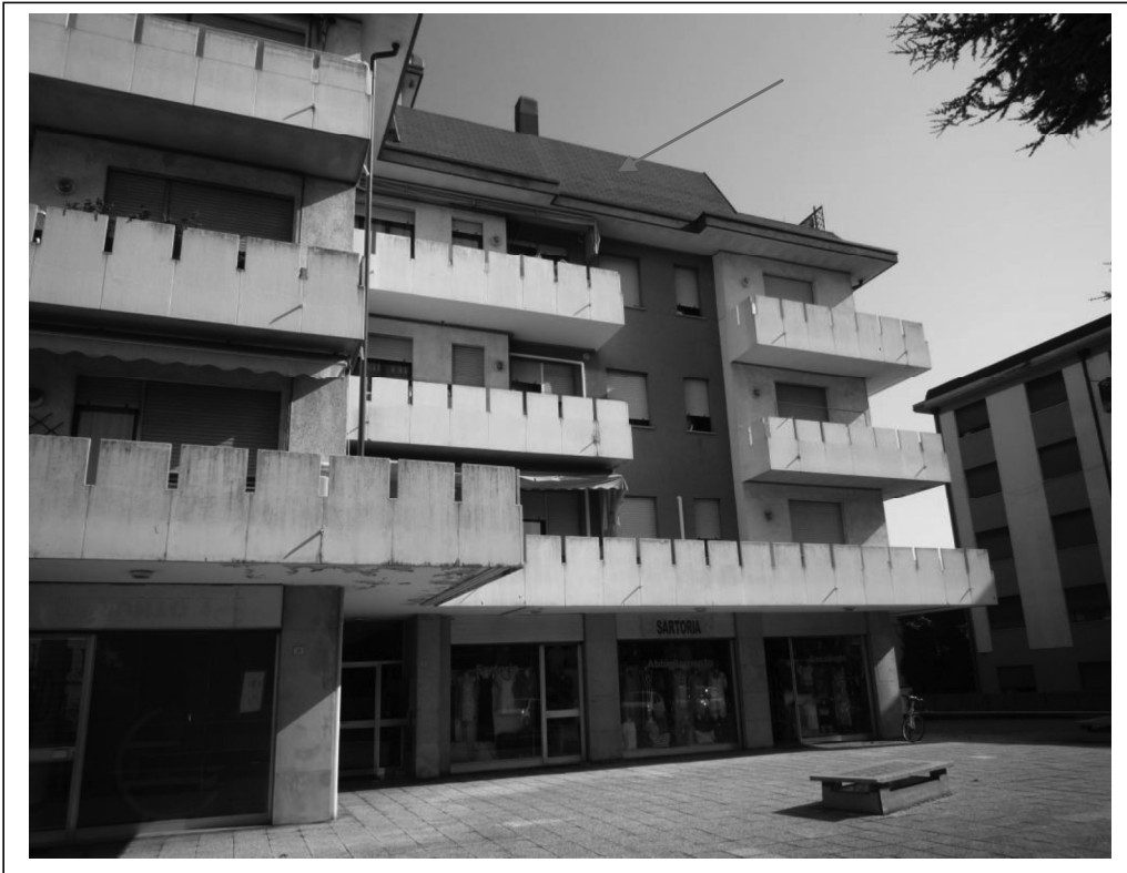
Vista sud del fabbricato con negozi al piano terra (corpo est)