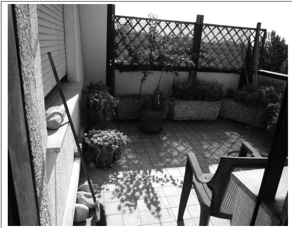
Terrazza a sud/est