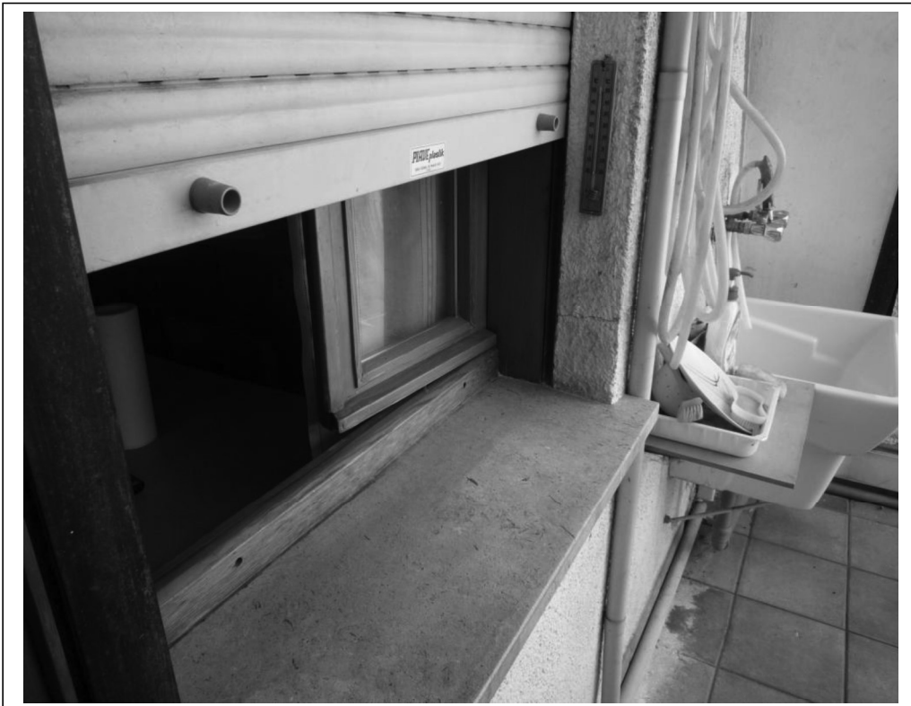
Particolare serramento a monoblocco