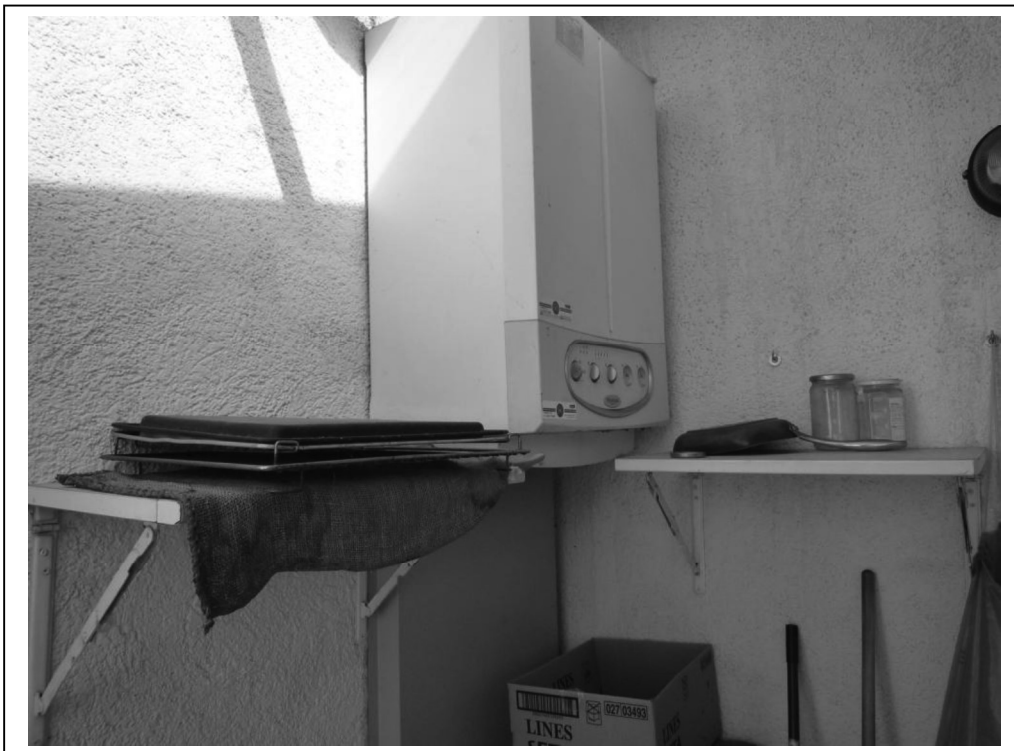
Caldaia a gas su terrazzino