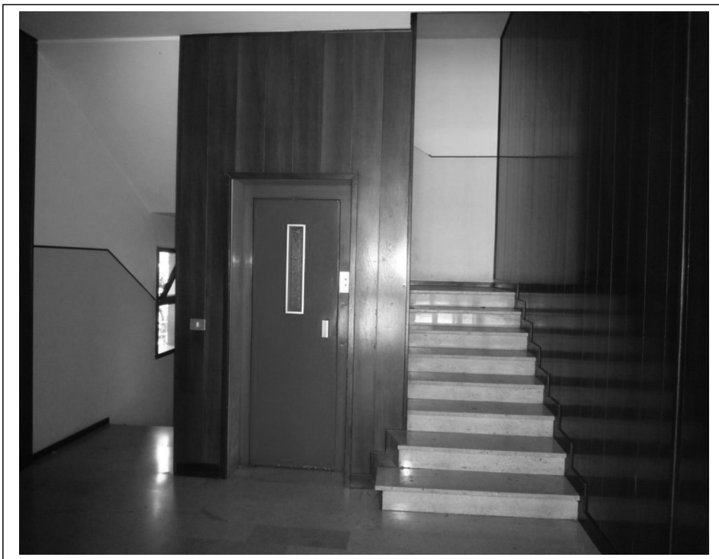
Androne d'ingresso con ascensore e scale di salita ai piani superiori e di collegamento al piano interrato dei garage