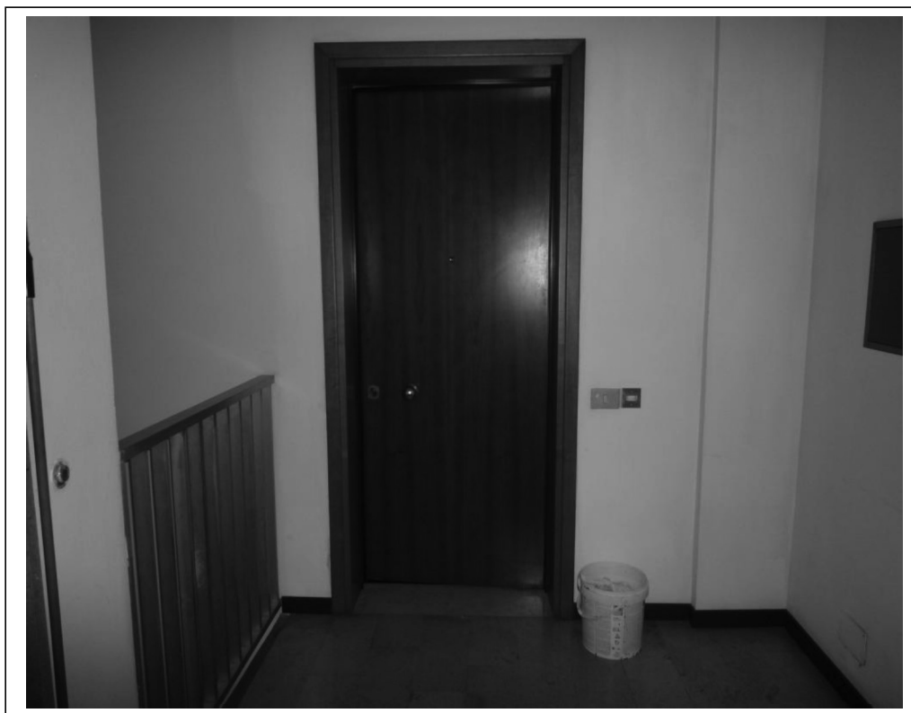
Portoncino d'ingresso all'appartamento