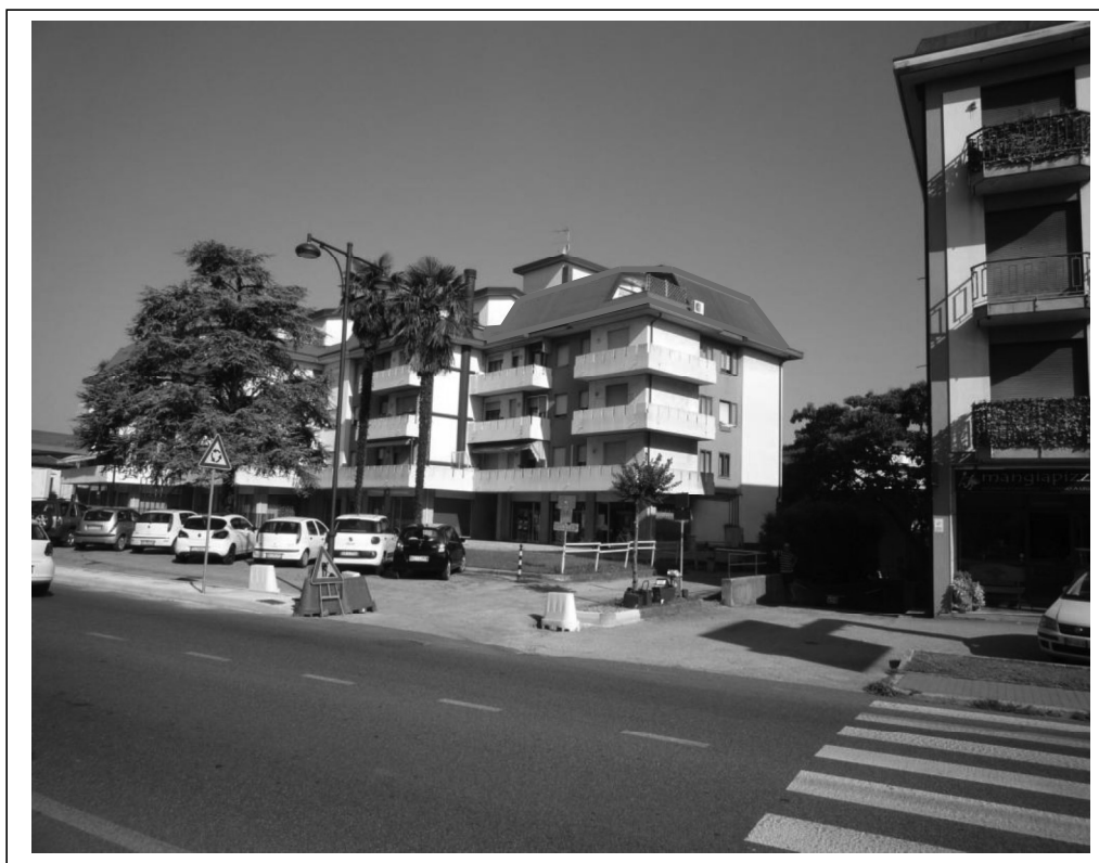
Vista sud/est del fabbricato