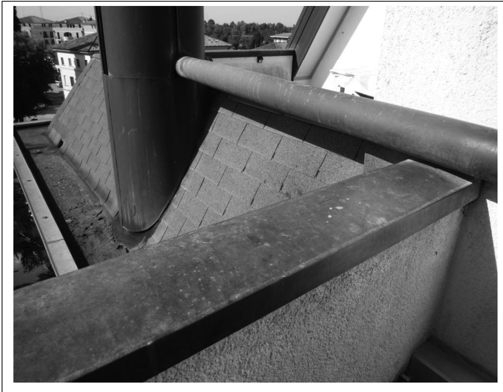
Particolari scossalina, grondaie e manto di copertura con tegola canadese