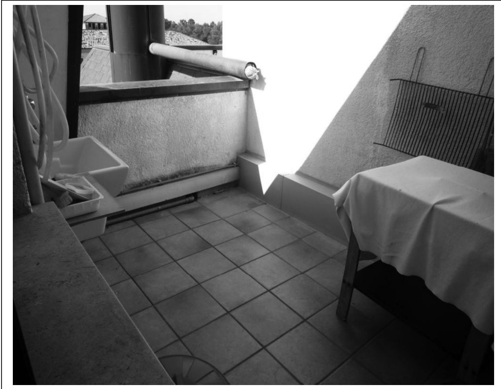
Terrazzino a sud