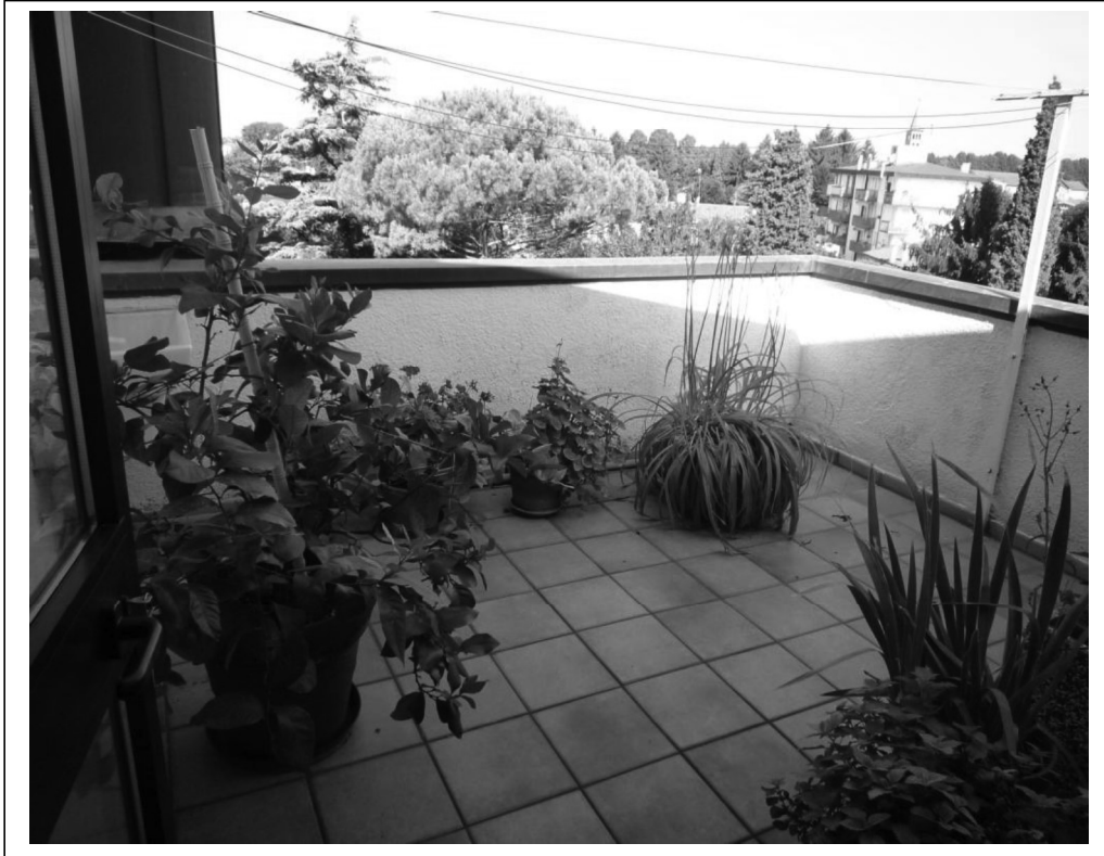
Terrazza a nord/ovest