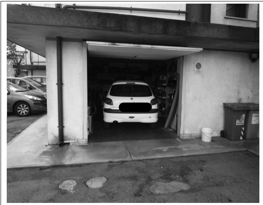
Vista interna garage