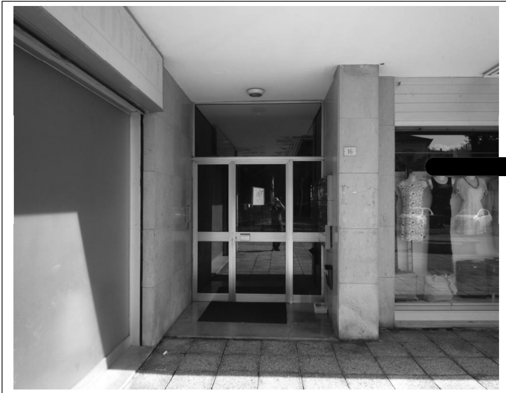
Ingresso fabbricato ala est