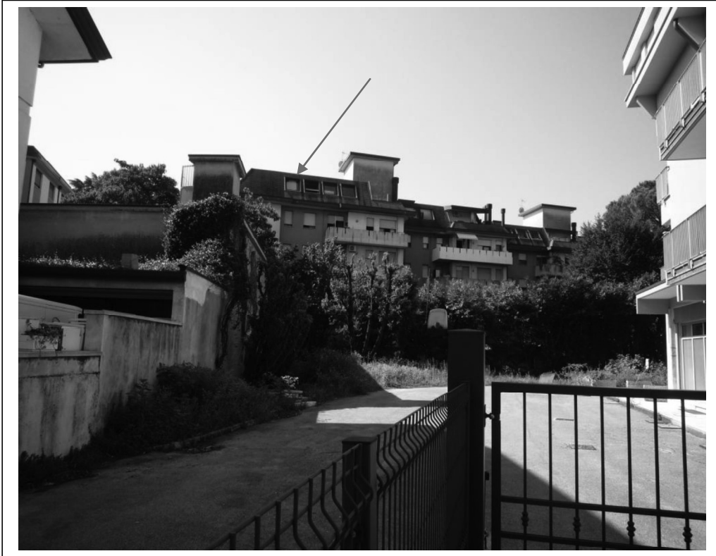
Vista nord del fabbricato