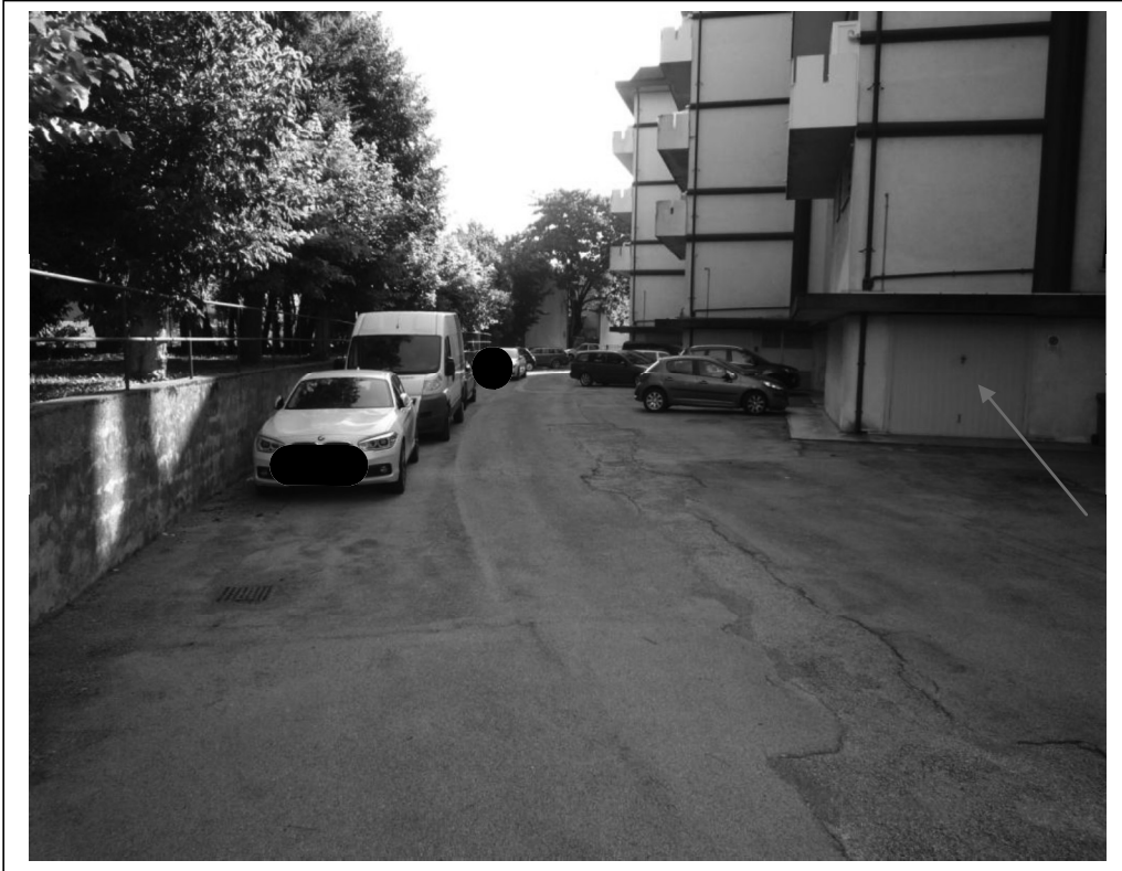
Spazio di manovra e basculante garage