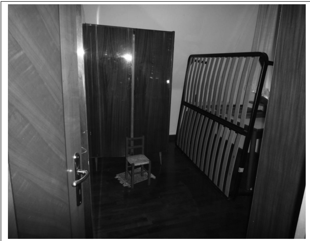
Seconda camera a due letti