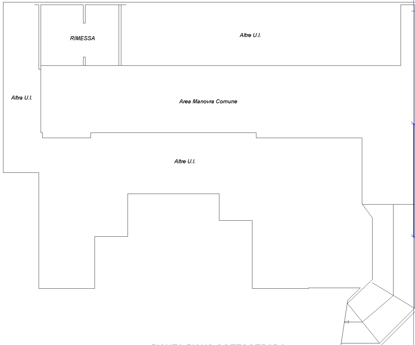
PIANTA PIANO SOTTOSTRADA H. = ML 2.40