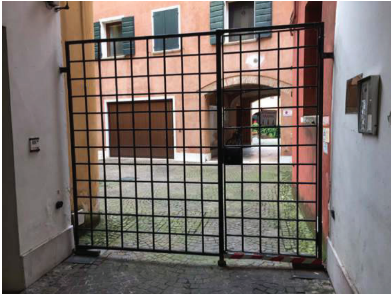
5 – Particolare del cancello di accesso da via G. da Coderta