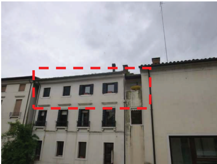
2 – Vista del prospetto Est