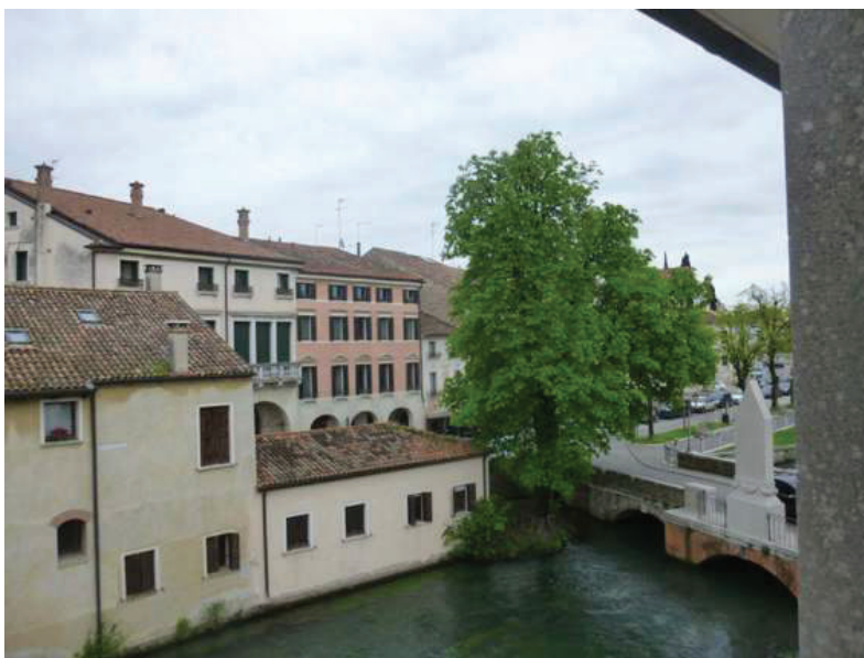
20 – Vista esterna dal terrazzino verso ponte Dante