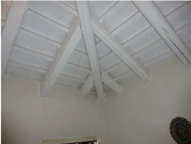
26 – Particolare della struttura in legno a vista della copertura