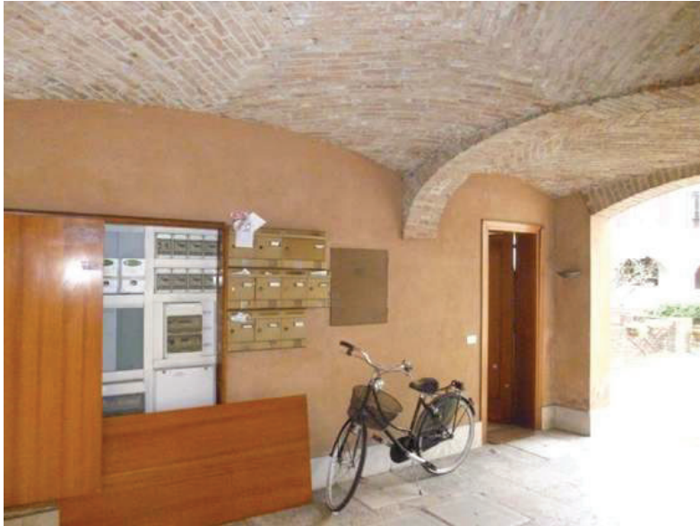
7 – Vista del sottoportico condominiale al piano terra