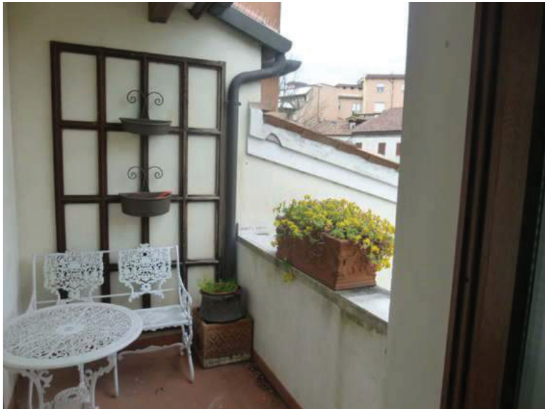
19 – Vista del terrazzino