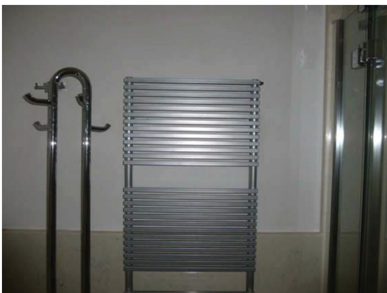
24 – Particolare di un radiatore