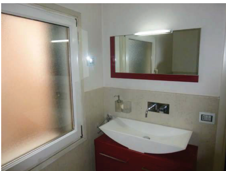
23 – Vista interna del bagno