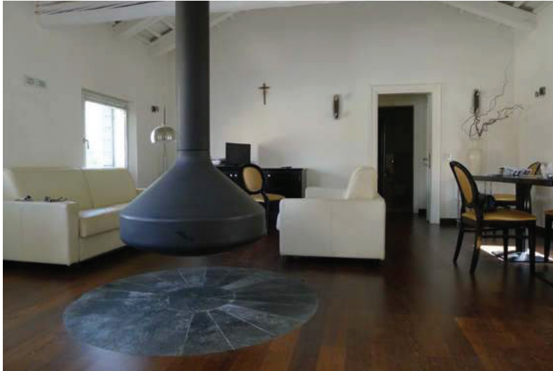
13 – Vista del soggiorno