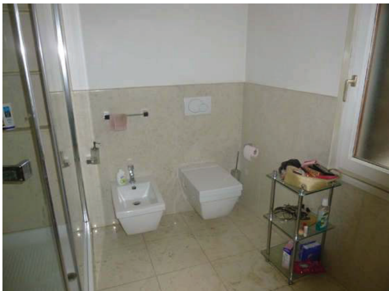
22 – Vista interna del bagno