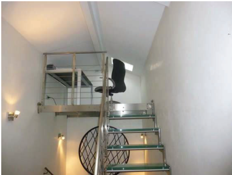
17 – Particolare del ballatoio sul vano scala