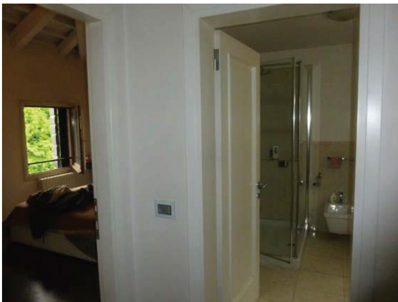
21 – Vista interna zona notte