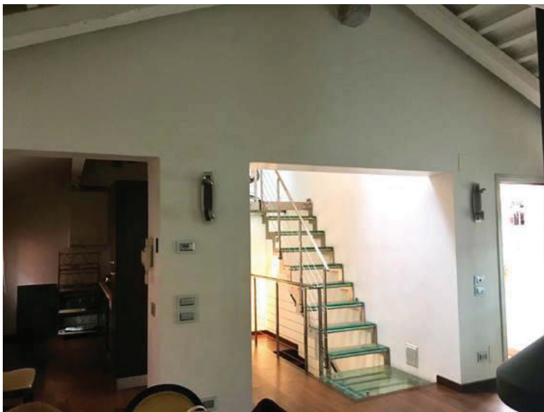
15 – Vista interna