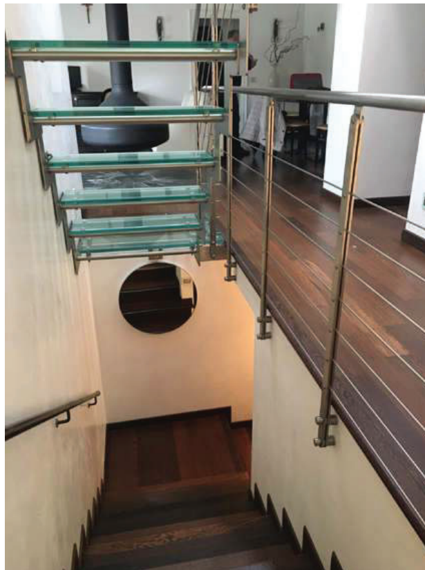
12 – Particolare della scala di ingresso di proprietà esclusiva dell'appartamento