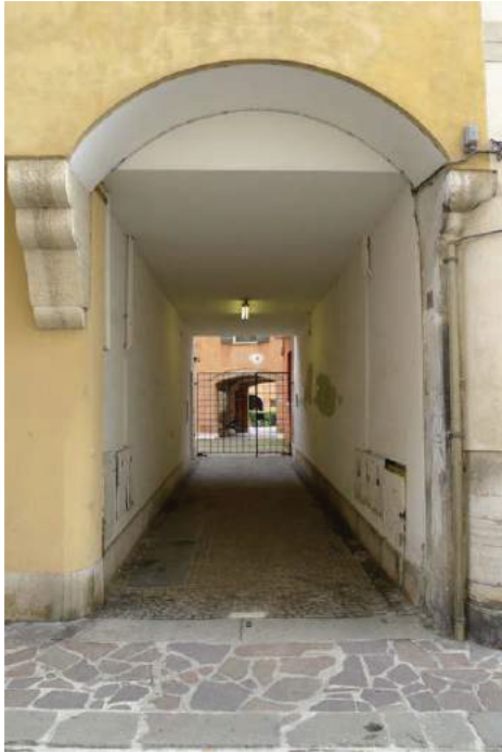
4 – Vista del sottoportico di accesso da via Gualpertino da Coderta