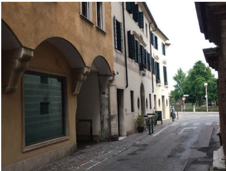
3 – Vista dell'accesso da via Gualpertino da Coderta