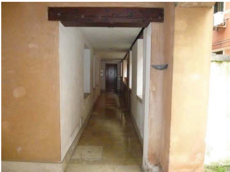
10 – Vista del corridoio condominiale di ingresso al piano terra