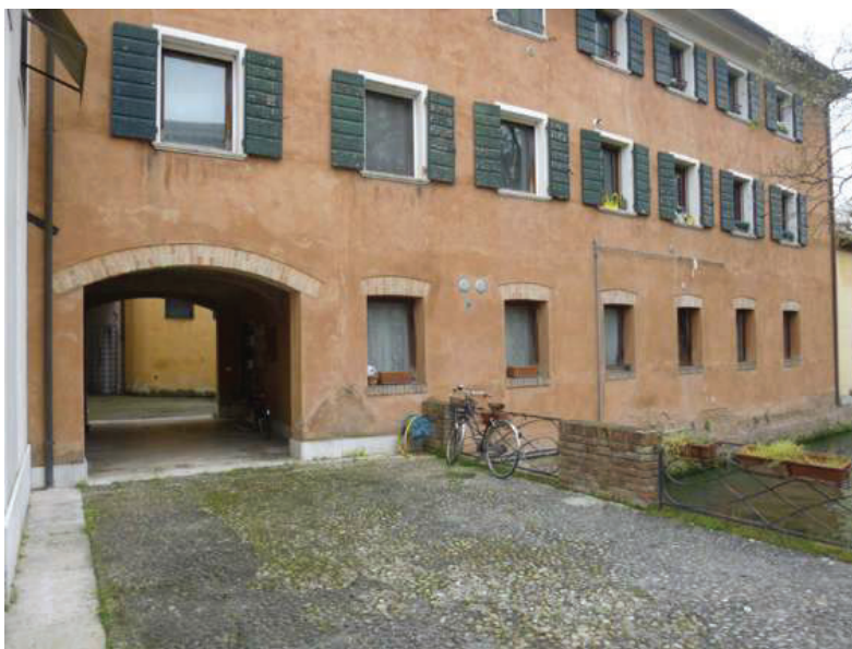
8 – Vista dell'area scoperta condominiale sul Cagnan Grande