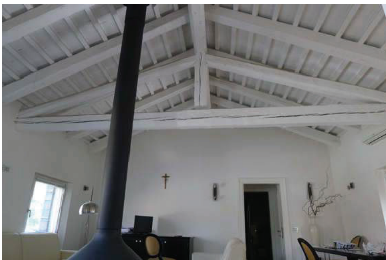
18 – Particolare della struttura in legno a vista della copertura