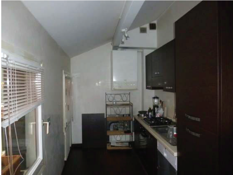
16 – Vista interna della cucina