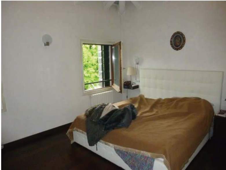
25 – Vista interna della camera