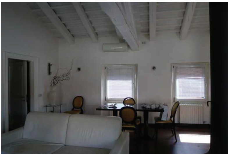
14 – Vista della zona pranzo