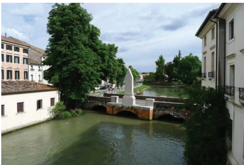
24 – Vista verso ponte Dante