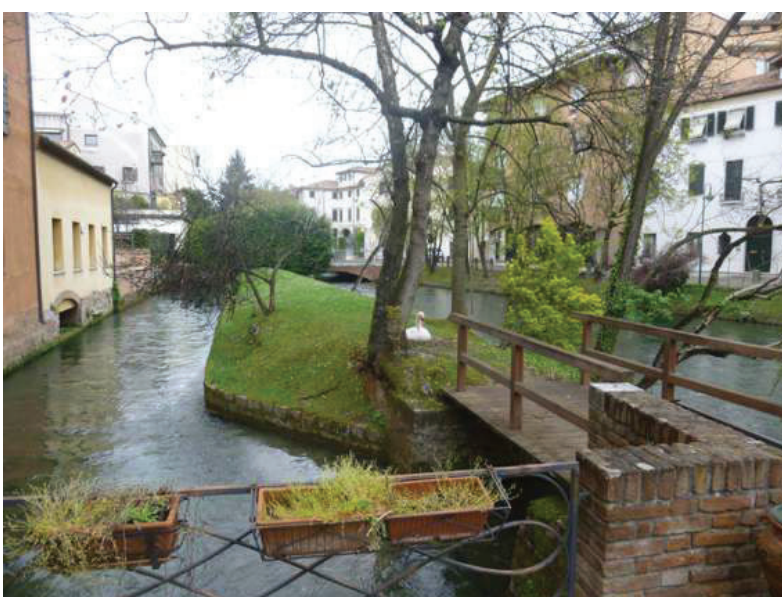
11 – Vista del ponticello e dell'area verde condominiali sul Cagnan Grande