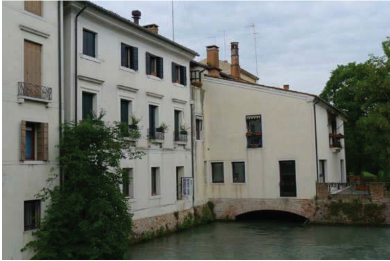
1 – Vista esterna da ponte Dante