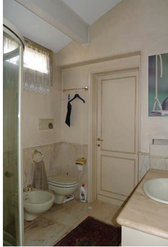
47 – Vista di un bagno al piano secondo