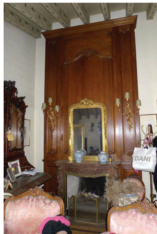
19 – Particolare del caminetto