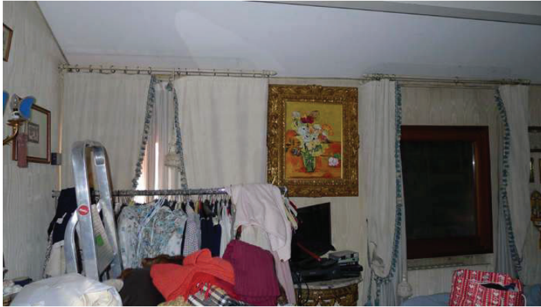
38 – Vista di una camera