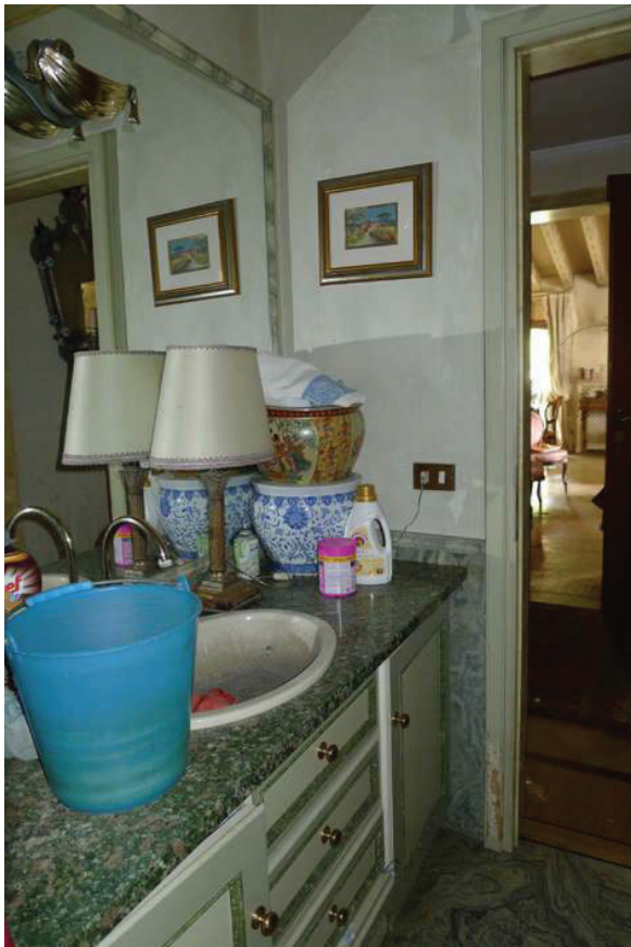
28 – Vista del bagno al piano primo