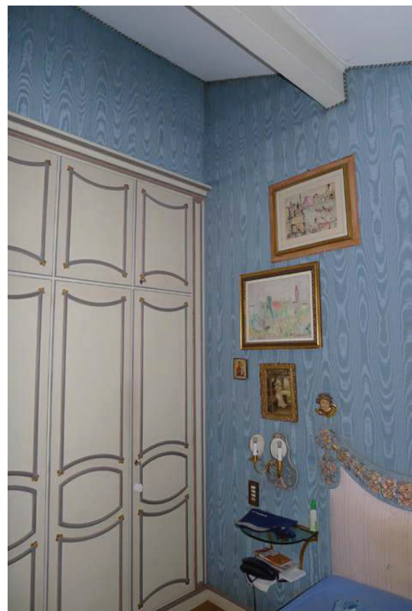
45 – Vista di una camera