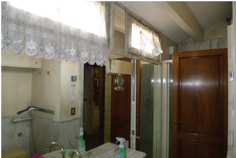
39 – Vista di un bagno al piano secondo