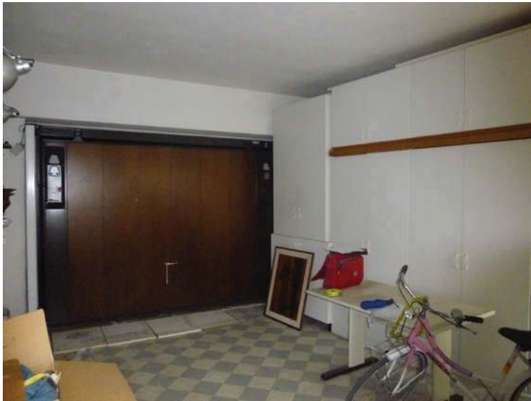
48 – Vista interna del garage al piano terra