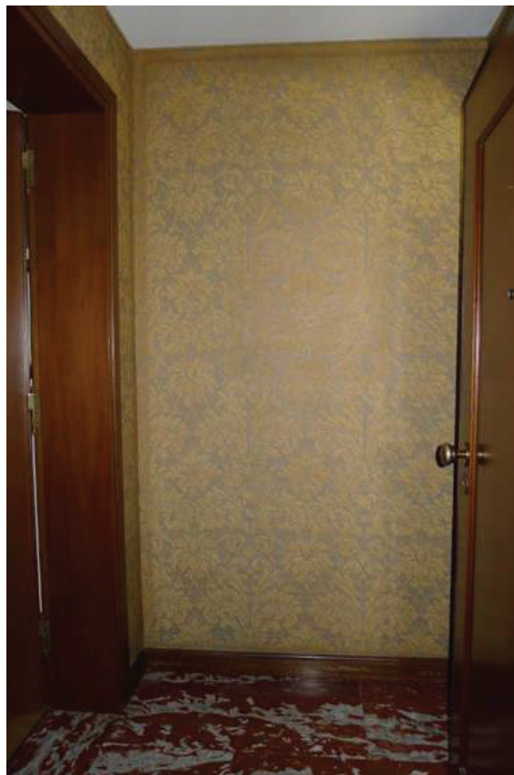
14 – Vista dell'ingresso dal vano scala condominiale