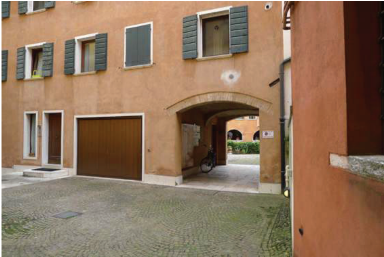
7 – Vista della corte interna condominiale e del portone del garage