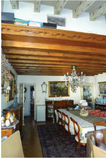
26 – Vista del soppalco