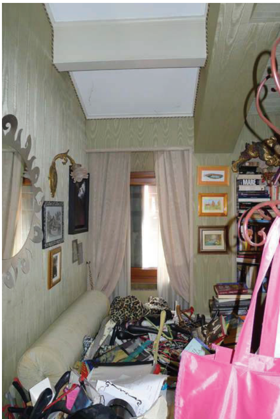
42 – Vista del ripostiglio al piano secondo