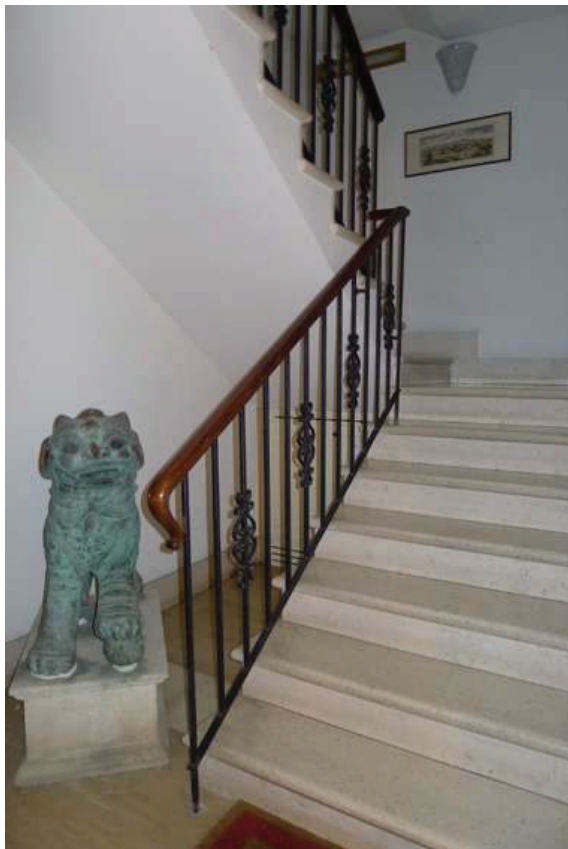
13 – Particolare della scala condominiale