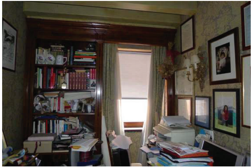
27 – Vista dello studio