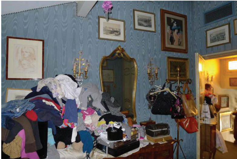
43 – Vista di una camera