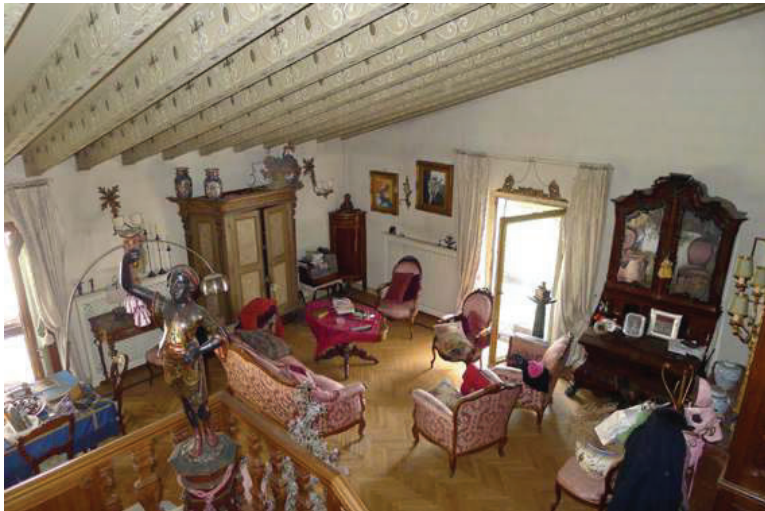
21 – Vista del soggiorno