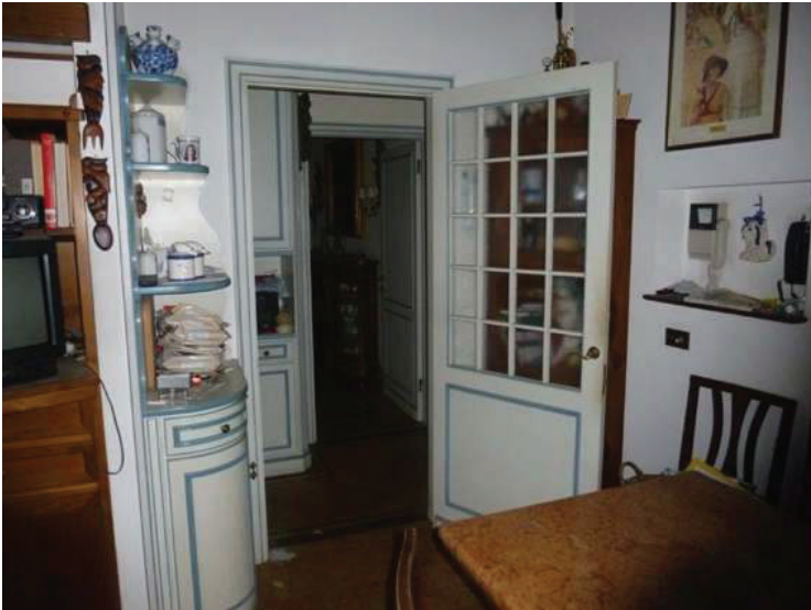
34 – Vista della cucina