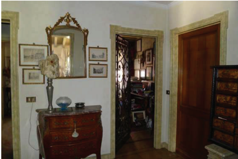
16 – Vista dell'ingresso