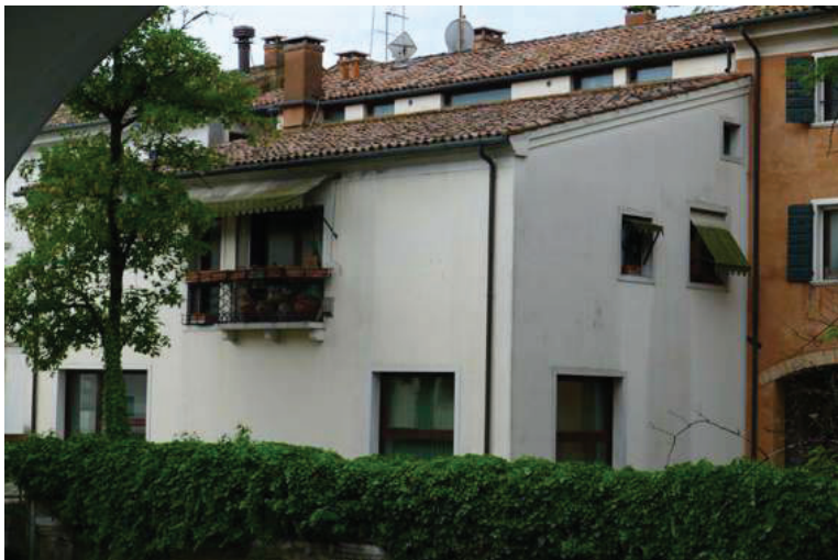
3 – Particolare vista esterna dei lati Est e Nord