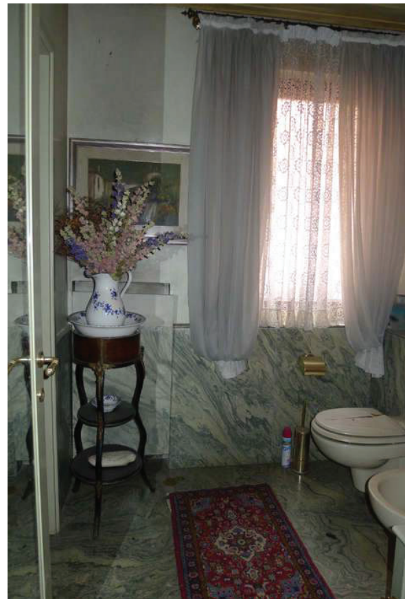
29 – Vista del bagno al piano primo