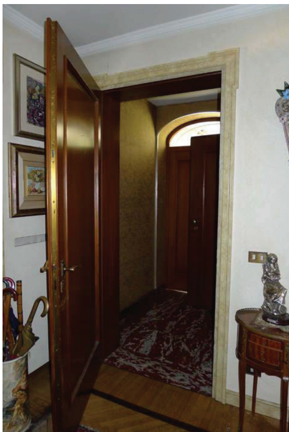
15 – Vista dell'ingresso