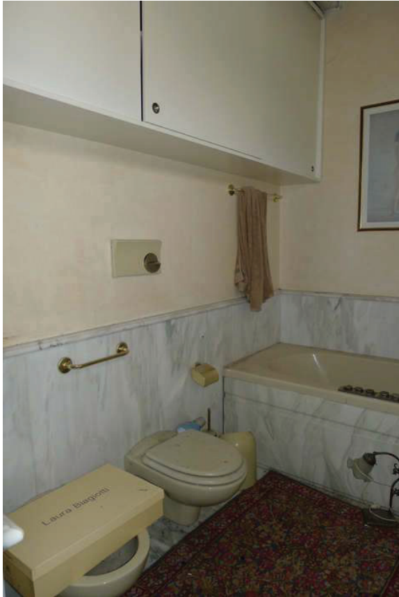
40 – Vista di un bagno al piano secondo