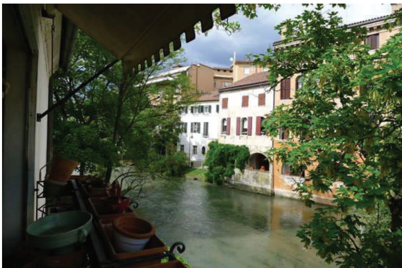
25 – Vista verso Nord-Est