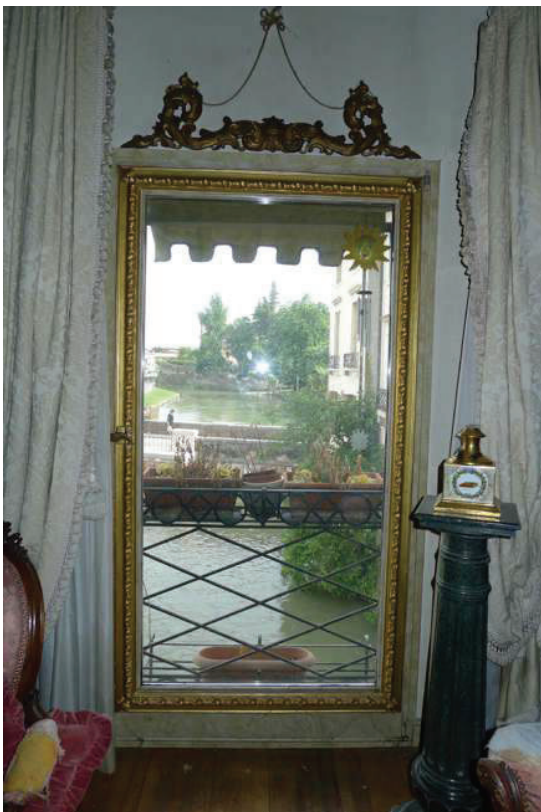
22 – Particolare di una finestra