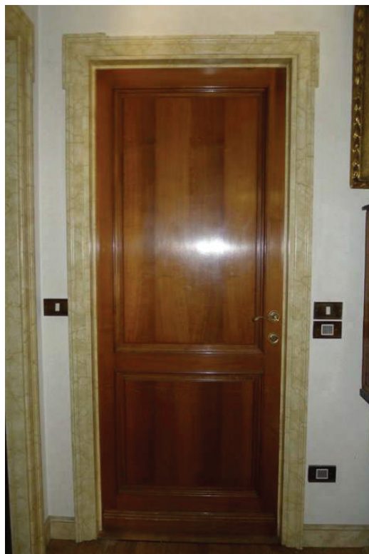
18 – Particolare porta interna