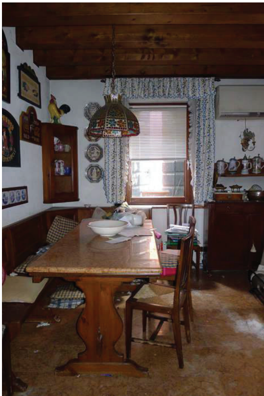
32 – Vista della cucina