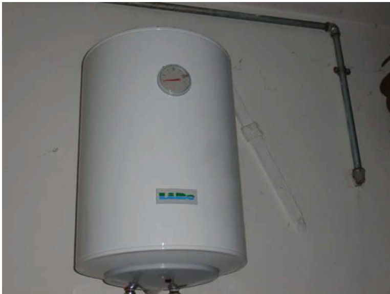
50 – Particolare dello scaldacqua