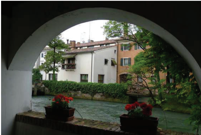
2 – Vista esterna da via dello Squero