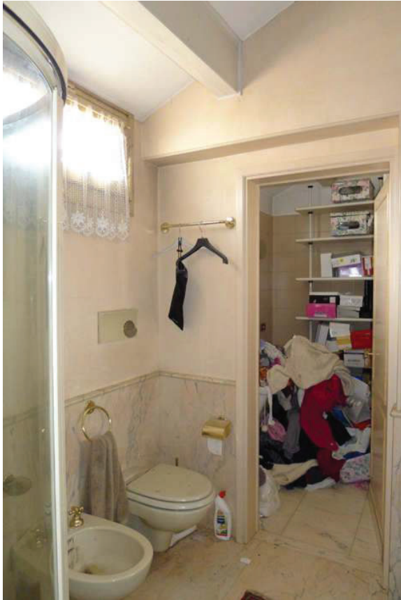
46 – Vista di un bagno al piano secondo