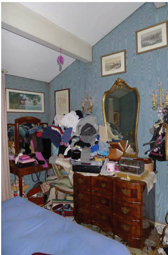
44 – Vista di una camera