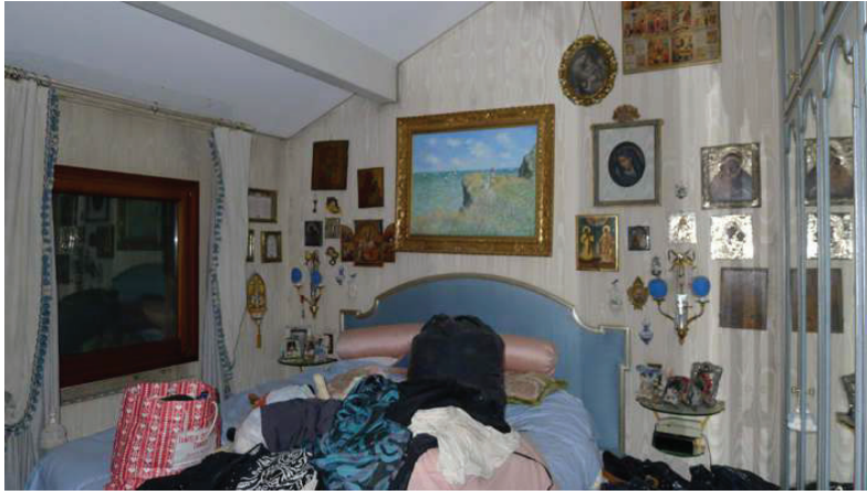
37 – Vista di una camera