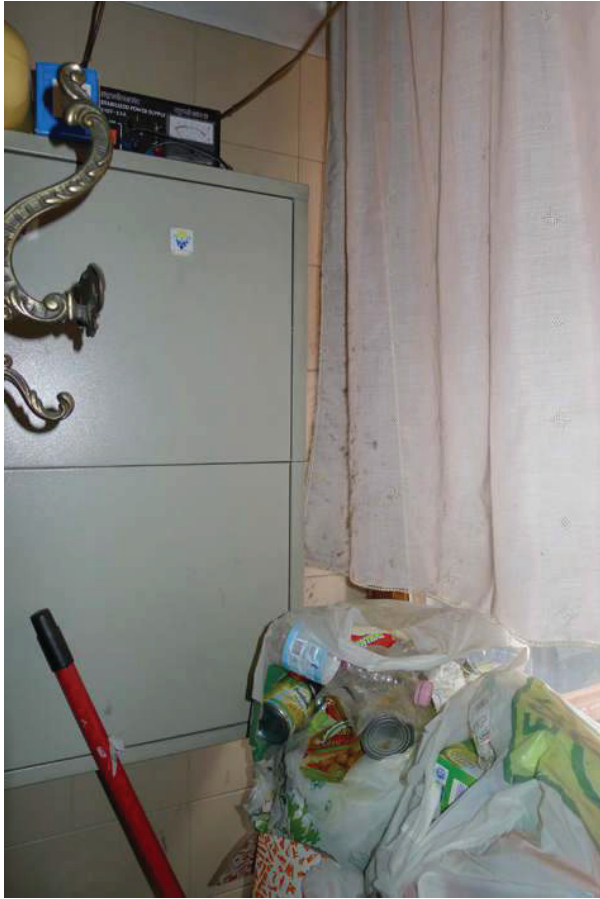
30 – Particolare di un ripostiglio al piano primo