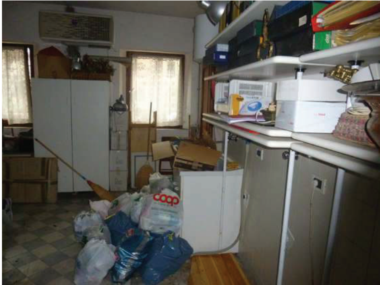
49 – Vista interna del garage al piano terra