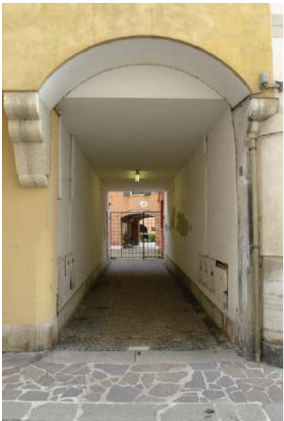
5 – Vista del sottoportico di accesso da via G. da Coderta