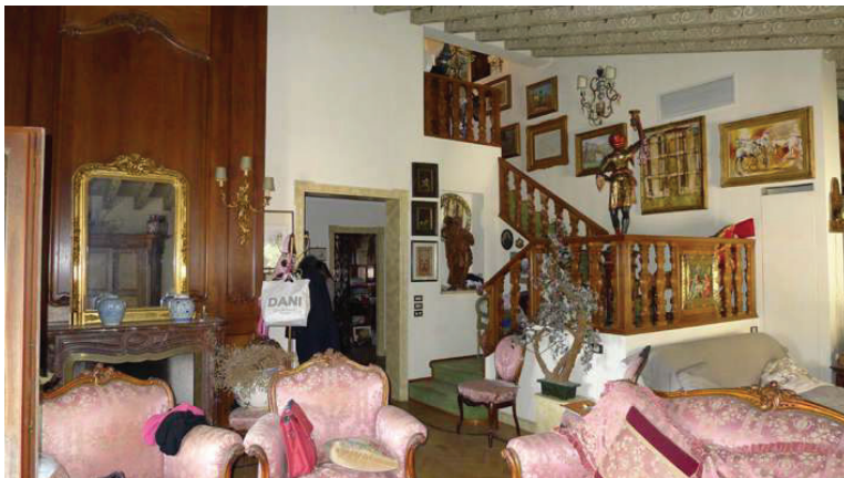
17 – Vista del soggiorno