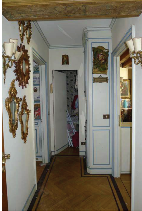
31 – Vista di un disimpegno al piano primo