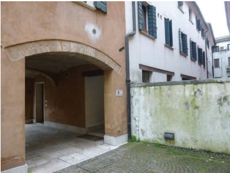
8 – Vista del fronte Ovest dalla corte interna condominiale