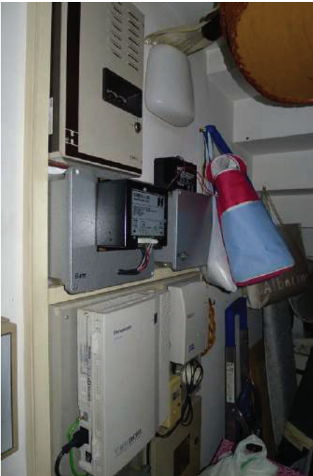
35 – Particolare del sottoscala