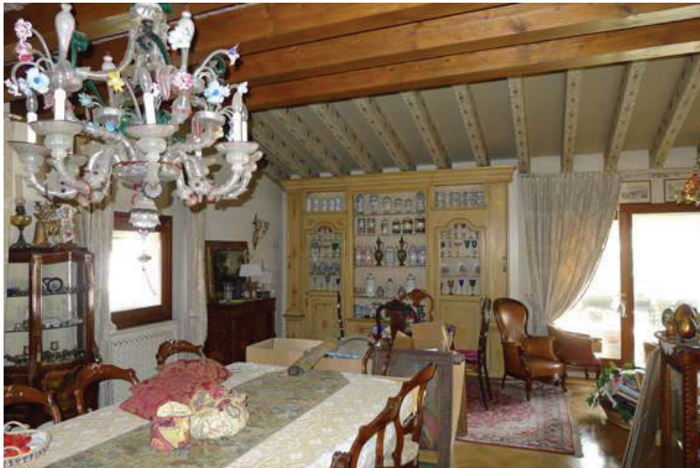
23 – Vista della zona pranzo