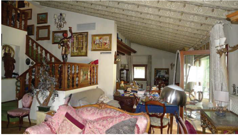
20 – Vista del soggiorno