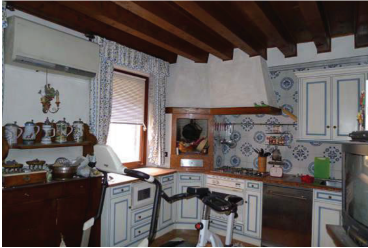
33 – Vista della cucina