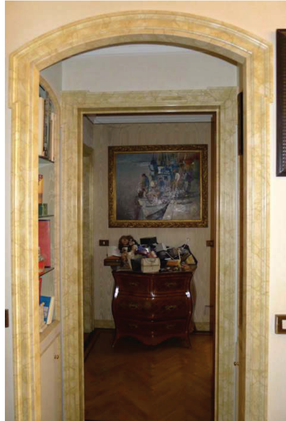
41 – Particolare del disimpegno al piano secondo