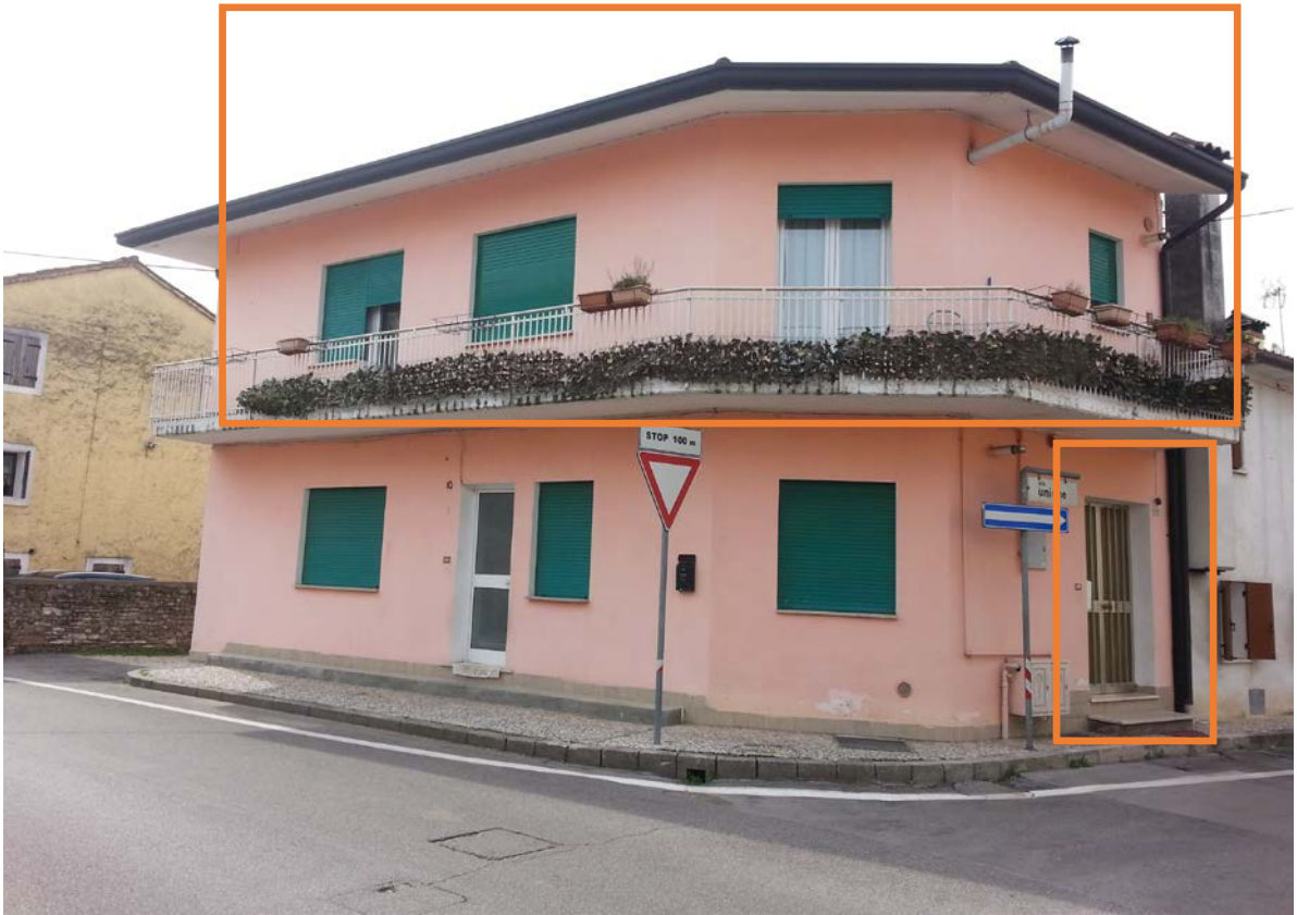
Prospetto est e ovest – Via Unione