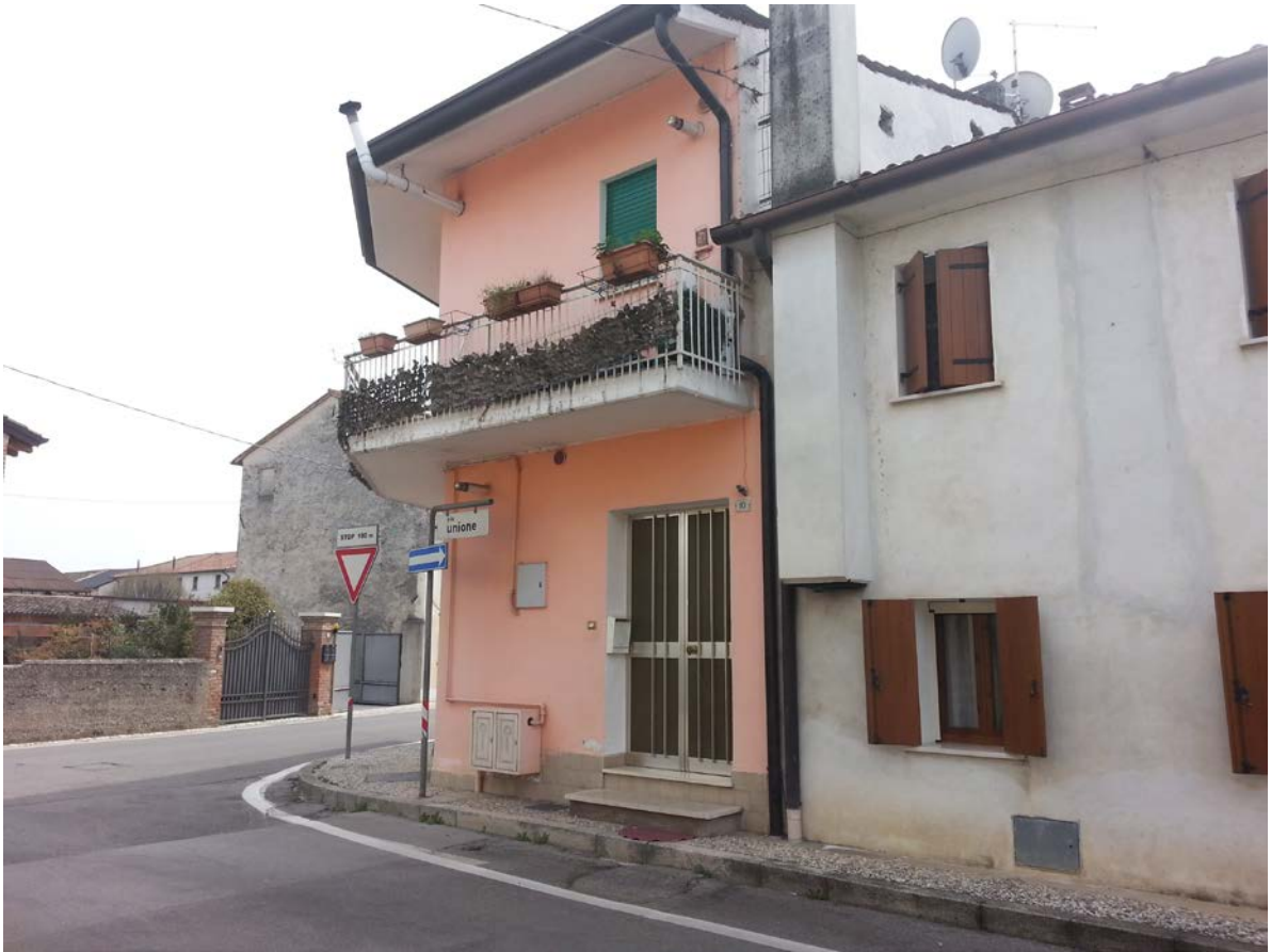
Ingresso da Via Unione