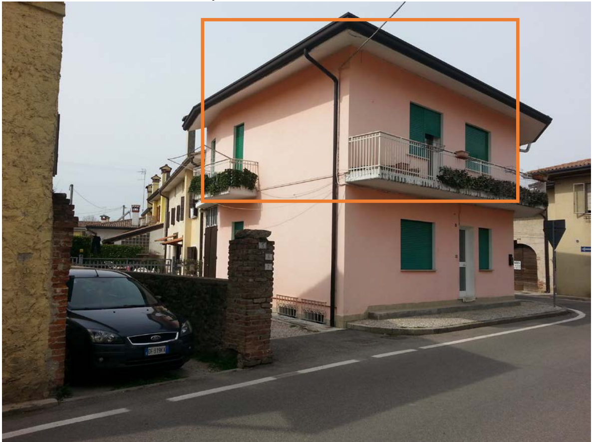
Prospetto sud e est – Via Unione